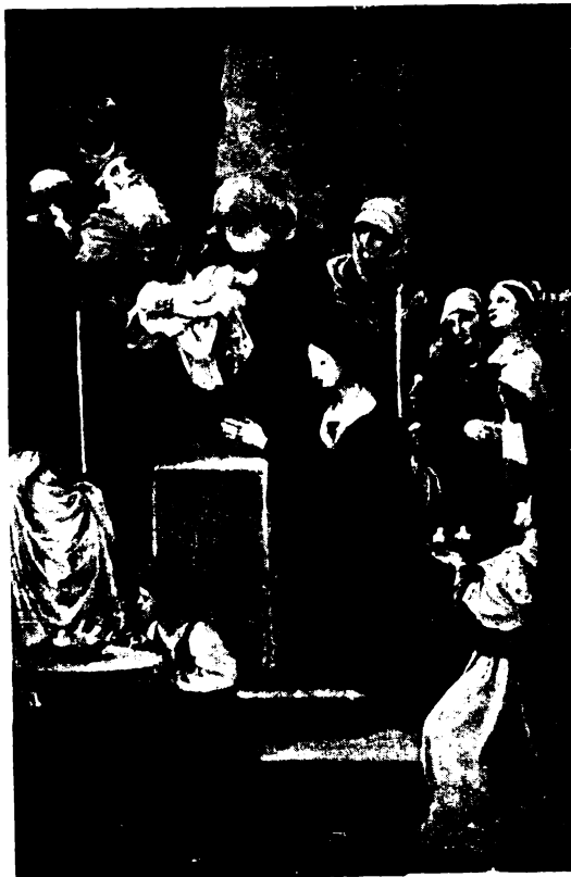
Kis Jézus bemutatása a jeruzsálemi templomban.

Az ajándék egész vagon rakomány virág, toronyóra láncsal. Fő a bőség. A kevesnek örülni nem tud. De-hogy ér rá megállni száguldó motorján! Csak föl a