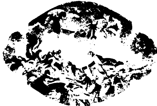
A revízió festménye a kegytemplom mennyezetén.

Az újévben erről beszél Besnyőn a hófedte erdő felett tovasuhanó téli szél. Vigye szárnyain a besnyői Szűzanya áldását magával magyar testvéreink szívébe és melegítse át különösen azoknak a lelkét, kik a messzi orosz mezőkön értünk küzdenek és kockáztatják drága magyar életüket egy boldogabb magyar jövőért.