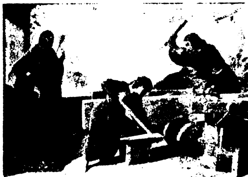
Müller: A Szentcsalád.