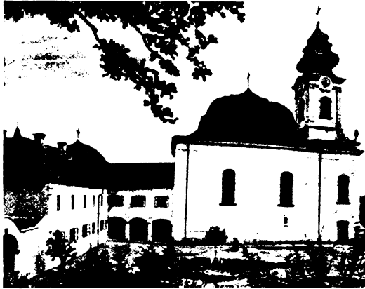
A máriabesnyői kegytemplom és kolostor.

Úrat dicsérték, ott most a pusztulás réme ütött tanyát.