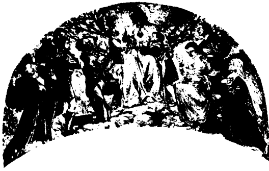
Márton: Jöjjetek hozzám mindnyájan!

A csodálatosan napfényre került kicsi szobrot a földesúr briliáns övvel, glóriával díszítette, művészi ezüst szekrénykébe foglaltatta és nagy tisztelettel övezte.