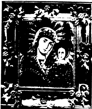
A kazáni Szent Szűz kegyképének másolata. Magyar katonák találták egy oroszországi templom pincéjében.

Röviddel ez előtt még mindnyájan azt hittük, vagy inkább reméltük, hogy a szent estén, mint boldog gyermek, Szeretteink körében lehetünk örömben, boldogságban. De nem így történt. Hiába várt a szerető, hűséges feleség, az aggódó Édesanya, a jó gyermek és kis leányka, hiába számolták, hányat alszunk és jön haza az Édesapa és a Jézuska. Ők, Jézuska és Édesapa most egymástól elválaszthatatlanok. Az Édesapa most azért harcol, hogy azon a földön ragyogjon föl a betlehem-i csillag, ahol felrúgták a kis Jézuska jászolyát, ahonnan elűzték az Istent, templomait lerombolták, megcsúfolták és nem volt hely, nem volt szív a végtelen orosz földön, ahol a Jézuska megpihenhetett, megnyugodhatott volna.