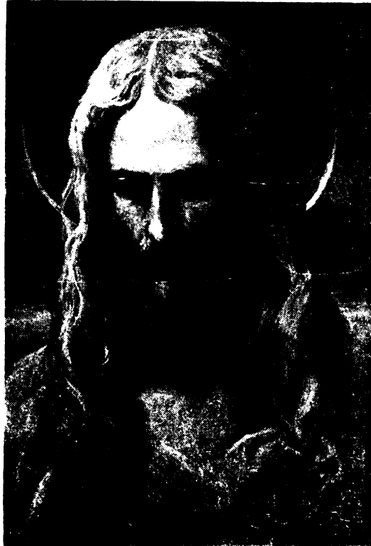
Az új Ádám, Jézus Krisztus, lelkünk eszményképe.

Felcserezte a cölöpre rakott régi házikókat a modern kényelemmel berendezett, egészséges, napsugaras lakásokkal. Valamikor a gazda fia vagy barma húzta a faokót, ma Ford-traktorral szántja a földet. Megszüntette a világárszek távolságait a rádió és telefon segítségével. Sőt a légbeli változásokat, viharokat is meg tudja akadályozni új viharágyúival. Ma már nem parity-