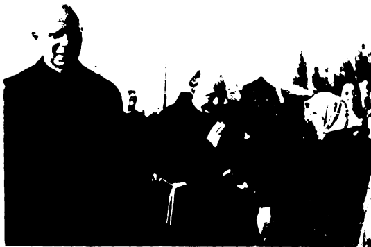
Főatyánk a nép között a debreceni bevonuláson. Ezrek sorfala között vonultak be az új atyák.

A pápákról az évszázadok folyamán a történeti meséknek egész koszorúját fonták azok az írók, politikusok, szónokok és népboldogítók, akik egy tál lencséért elarulták az igazságot és könnyelmű gesztussal tömjént szórtak a nagy tömeg buja fantáziája elé. Nagy kiterjedésű irodalma van ennek a beteges törekvésnek, amely minden időben kitűnő üzletnek bizonyult. Sok író-mesefonó így szerzte millióit és villáit, sok kiadó-vállalatnak neve ettől a történeti hullaszagtól duzzadt világhírnévvé.