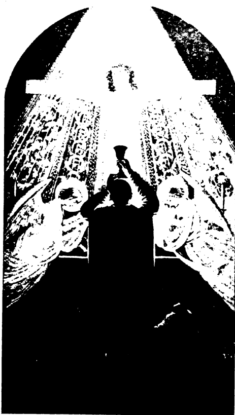
A titokzatos Krisztus áldozata a szentmise. Jézus Krisztus keresztáldozatának megisméltése.

De azonkívül még abban is bízunk, hogy amit Jézus Krisztus testéről ki akarunk fejteni, azok számára sem lesz hiábavaló, akik a katolikus Egyháztól el vannak választva. Nemcsak azért reméljük ezt, mert ez utóbbiak jóakarata az Egyház iránt láthatóan napról-napra növekszik; hanem azért is, mert amikor látják, miként kel föl nemzet nemzet ellen, ország ország ellen és miként növekszik szinte a végtelenségig a széthúzás, versengés és gyűlölet; az Egyházra tekintve pedig azt veszik észre, hogy benne minden fajú ember testvéri szövetségben egyesült Krisztussal; akkor bizonyosan meg fogják csodálni ezt a szeretetszövetséget