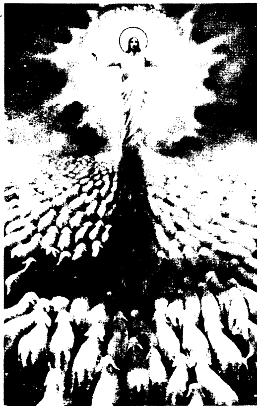
A titokzatos Krisztus, vagyis az Egyház őrzi, vezeti, tanítja a hívő nyáját a világ végezetéig.

Az Egyház szerves „hierarchikus” egység. Továbbá, miként a természetben a tagoknak nem akármilyen halmaza alkot testet, hanem szükséges, hogy a testnek szervei legyenek, azaz olyan tagjai,