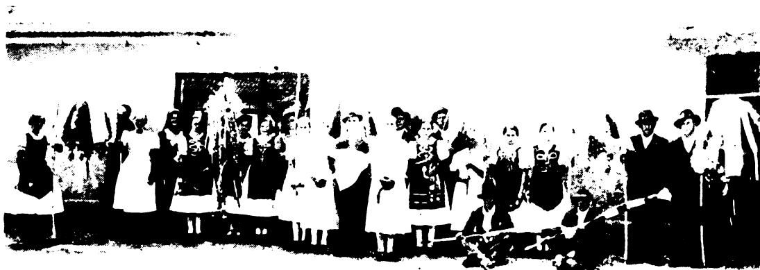
Az aratási felvonulás szereplői és jelképei: az aratókoszorú, aratási szerszámok és a magyar föld legdrágább gyümölcse, a magyar kenyér.

Csodálatosan megragadó ebből az ünnepségből két kép: Délelőtt a pap nyújtja a híveknek az égi Kenyeret, délután pedig az arató gazda adja a papnak a földi kenyeret. Milyen lélekbemarkoló kifejezése ez annak, hogy testvérek vagyunk, emberek vagyunk, akik testből és lélekből állunk és éppen ezért kenyérral és Igevel élünk. E kettőt kívánjuk. E kettőre van szükségünk. És azért vagyunk mindannyian testvérek, hogy egymásnak ezt nyujtsuk. A föld népe elővárásolja mindennapi odaadó munkájával a mindennapi kenyeret, a pap pedig, aki odaadta magát Istennek, kielégíti lelkünk vágyait, a hitet és örökkétartó örömeiben reményt ápolja bennünk, amely megédesíti és megengeszteli földi életünk küzdelmeit.