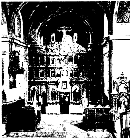
A kegytemplom belseje.

Ugyanebben az időben állottak szemben a törökek az egyesült keresztény seregek Savoyai Eugén