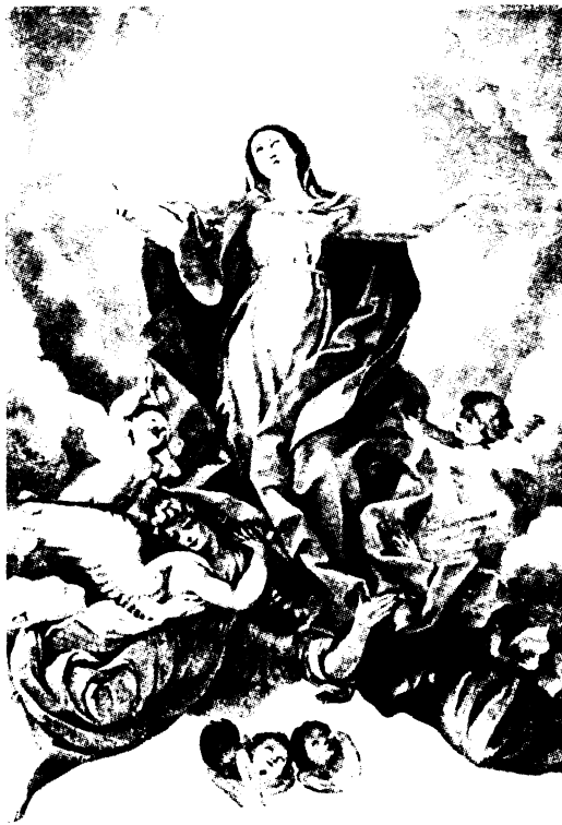
Guido Reni: Nagymasszonyunk mennybemenetele

S íme, odaértek a S. Lorenzo fuori le mura-hoz , Róma hét bazilikájának egyikéhez. Ez az ősi szentély, koszorús oszlopaival, csodálatos mo-