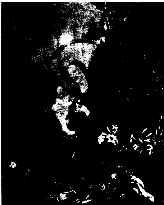
Üdvözlégy május hajnala... (M. Grunewald)

Idézzük hát újra és újra a szellemét és különösen a szenttéavatás esztendejében töltekezzünk az Ő lelkületéből, s igérjük meg neki, hogy újjáépítjük az Ő kolostorát, hogy ott álljon imáitól és vezekléseitől megszentelt paradicsomi földön: a Szent Margitszigeten mint magyarságunk erkölcsi értékének verhetetlen bástyája és fellegrára!