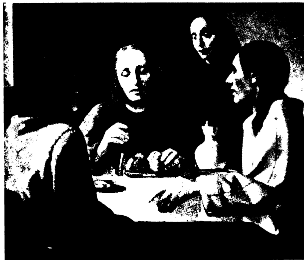
Emmasban... (Jan Vermeer von Delft.)

A sok fájdalom és lelkekre nehezedeő gyász után végre felvirradt a feltámadás napja. Nagyszombat este a fél város ott szorongott a Dómtér vörös kövein, hogy résztvegyen a feltámadt Krisztus nagyszerű diadalmenetében. Hosszas várakozás után végre belekondult a halk hangzavarba a dóm nagyharangjának mély, bűgő hangja. A torony körül felriasztott galambok sűrű csapata keringett a harangzúgásban. — A templom kapujában megjelentek az első zászlók, a nagyharang szavába csengve-bongva sok más harang szava szót bele és megindult a menet. Hosszan kigyózott végig a téren, az eleje már lent járt a dómtér határan, mikor a vége még a templomban sorakozott. A