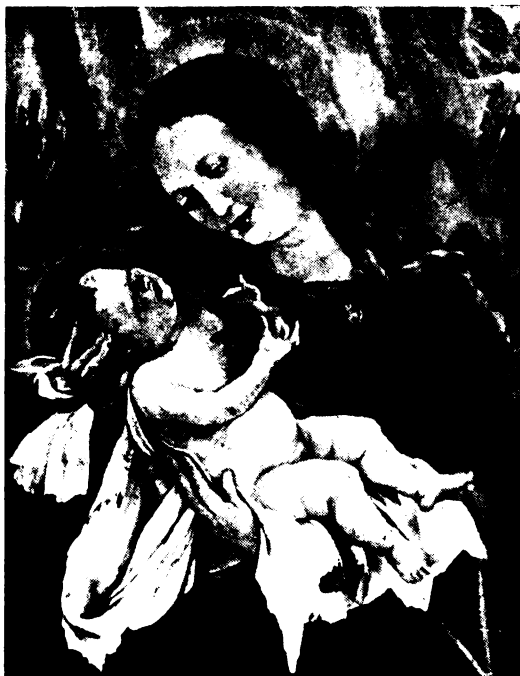
Téged rendelt jó Anyánknak az Isten Fia. Azért áldunk örörendezve, ő, Szűz Mária! (M. Grünewald.)