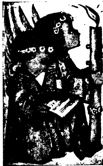
Újra ég a húsvét-gyertya, Minden vigad, alleluja: Feltámadott Jézus!