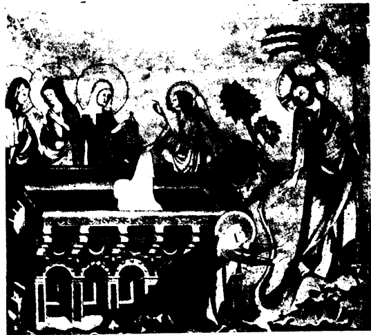
Foltámadt, nincs itt... (Teilstück)

Ebből a mélységből kiáltunk Hozzád, Urunk, hallgasd meg szavunkat! Tépd ki életünkéből az embertelenséget, töröld le a bűnt, oltsd ki a szeretetlenséget és azt a páratlan önzést, amely az emberiséget ebbe a soha nem látott fertőbe taszította! Sugározz a mélységbe fényt! És hozzá! éjtszakáinkra békés hajnalt, áldó napot, derűt, é l e t e t! Virraszd fel a mi hűsvétunkat is! Száritsd föl könnyeinket, s taníts meg a dalra: alleluja, hála legyen az Istennek! — i —