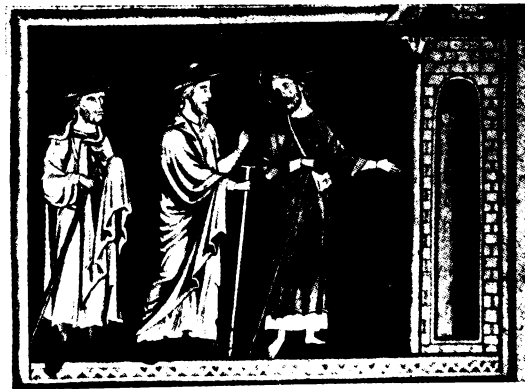
Maradj velünk, Uram... (Ingeborg-Psalter.)

Anyja mégse ezt az áldott vidéket dicsérte a rokonoknak.