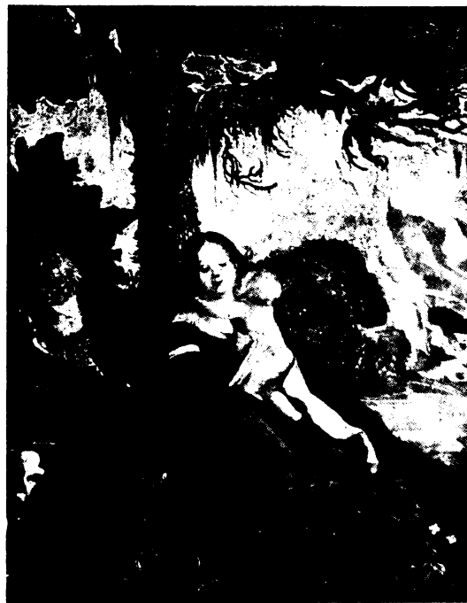
A Szentcsalád legdrágább kincse a Gyermek. (L. Cranach.)

Így peregnék az Istenben élő család napjai, tán szenvedésben, nyomorúságban, de egyetértésben, békében, szeretetben.