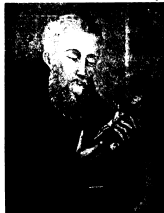
B. Kelemen Didák, a magyarság vigasztalója.

Kétszáz esztendő telt el azóta, hogy Kelemen Didák öröklétre szenderült. Kétszáz esztendő hosszú idő, még sem tudta elfeledtetni kedves egyéniségét, homályba burkolni szeretetreméltó alakját. Kortársai szentként tisztelték és szentségének illatát érezzük mi is. Vigasztalója volt akkor a magyarnak, kérjük mi is, hogy ezekben a szomorú időkben nekünk is erősítőnk, bátorítónk és pártfogónk legyen.