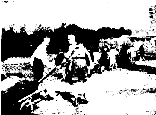
Hív a Nagyerdő!