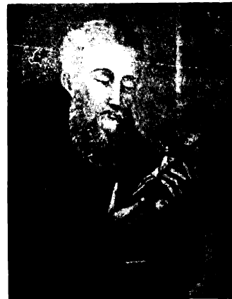
B. Kelemen Didák, a magyarság vigasztalója.

Kétszáz esztendő telt el azóta, hogy Kelemen Didák öröklétre szenderült. Kétszáz esztendő hosszú idő, még sem tudta elfeledtetni kedves egyéniségét, homályba burkolni szeretetreméltó alakját. Kortársai szentként tisztelték és szentségének illatát érezzük mi is. Vigasztalója volt akkor a magyarnak, kérjük mi is, hogy ezekben a szomorú időkben nekünk is erősítőnk, bátorítónk és pártfogónk legyen.