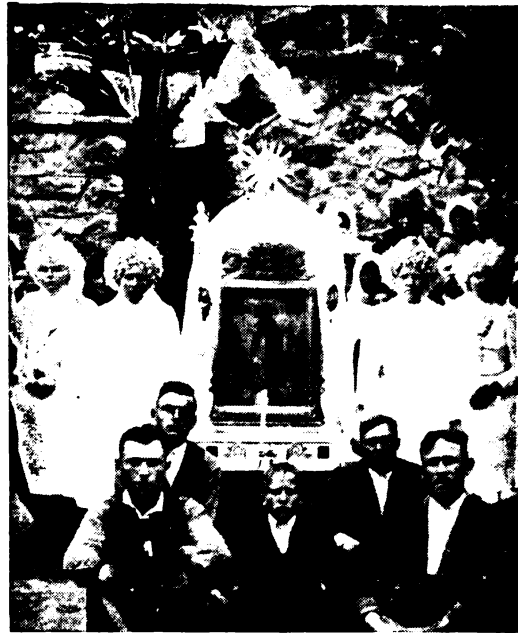
A nagyrédei Mária-lányok a szentkúti búcsún.

5. FÁKLYÁSOK — LOBOGÓSOK. — Meg kell őket említenünk, mert szorosan hozzátartoznak a Mária-lányok intézményéhez. A fáklyások az oltárnál és a körmeneteknél, a lobogósok pedig csak a körmeneteknél szerepelnek. Gyöngyöspátán pl. 15 Mária-lányról beszélnek. Ebből 4 Márialány, vagyis Mária-hordozó, 6 lobogós, 4 gyertyás, vagy fáklyás, 1 pedig jézuskás, vagyis a keresztet viszi a Hordozó Mária előtt. A Máriának ú. i. a körmenetekben külön kísérete van. Gyöngyöspátán keresztje is, amely a Mária-hordozás külön szerepét pompásan domborítja ki. Egy, vagy két zászlót is visznek a Mária előtt, az ú. n. Mária zászlaját. A fáklyások pedig rendszerint az Oltáriszentség mellé, avagy elé rendelt lányok. Gyöngyösön legények látják el a barátok templomában a szentélyi fáklyás szolgálatot, a rózsafüzértársulati lányok csak a társulat első vasárnapj, ill. a hónap első Mária-ünnepén esedékes miséjén állnak lámpával az áldozatórács mögött a