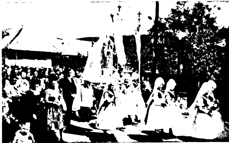
A gyöngyöspatai Mária-lányok a pünkösdi búcsún ingvállban és piroskendőben.

A Hordozó Máriához tartozó lobogós és jézuskás lányok kiválasztása is a Mária-dajka, valamint a plébános dolga.