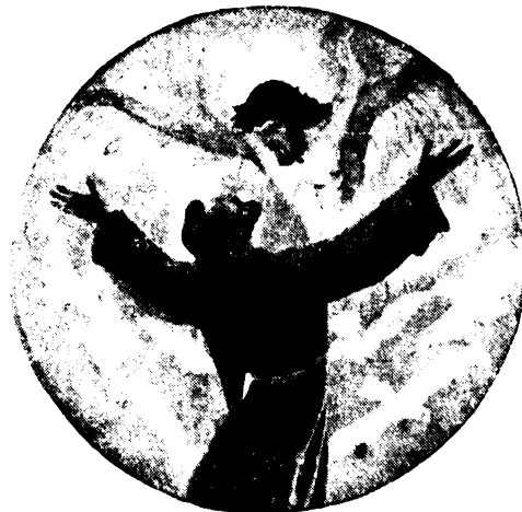
Istenem és Mindenem!

Június 25-én tisztelői szentmisén jelentek meg a belvárosi ferencesek templomában, hogy halála évfordulóján áldozzanak fennkölt szellemnek. Előszedtem a Keddi Posta számait és érdeklődtem leveleit s olvasva, böngészgettem: „Emlékezzünk régiekről”. S emlékezve, mély érzéssel hajtunk fejet a magyar katolikus irodalom gondolata egyik büszke szervezőjének, hordozójának emléke előtt.