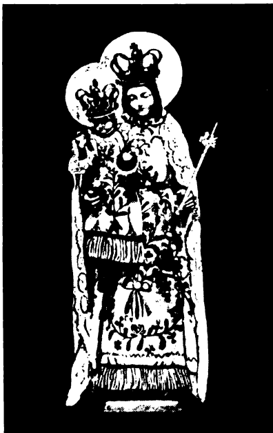
A szücsi Hordozó Mária magyaros ruhában.

A Mária-lányok közül rendszerint azzal válnak ki a lányok, hogy férjhez mennek. Szentjakabon az esküvő előtti vasárnap feketébe öltözik a menyasszony, a Mária-lányoknak nincs külön szokásuk. Gyöngyöspatán azonban esküvője napjának reggelén, a szentgyónás és szentáldozással egybekötött misehallgatás után, mikor a kántor elimádkozta a néppel a misetáni imát, a Mária-lány letérdel a Hordozó Mária számolyához, kissé imádkozik, s megindul a Mária-dajka felé, aki a padból már eléje tart, s kölesönös csókok és könnyek közt vesznek egymástól búcsút. Rózsaszent-