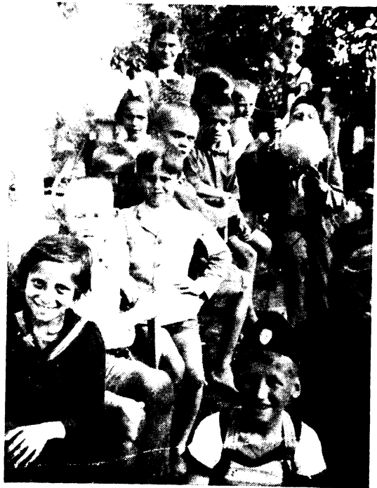
Kis szünet a nagy játékban.