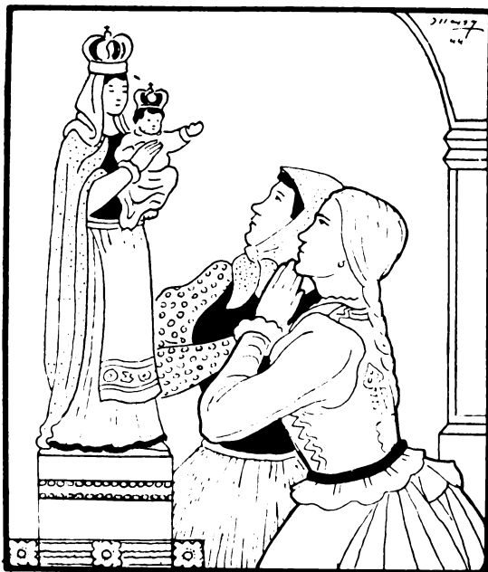
Most segíts meg Mária!

Hasonlóképpen hajthatatlan jellemű férfiú volt utódja, Szent Szilvériusz pápa. Rövid uralkodási ideje tele volt fájdalmas csalódással, szenvedéssel és üldözöttséggel. De nem torpant meg semmiféle nehézség előtt sem. „A csalódással keserített szenvedések kenyerét eszem és a szorongatások vizét iszom, de szent hivatásom kötelességét életem árán sem mulasztom el.” Életét vértanúhalállal fejezte be Palmaria szigetén 538-ban.