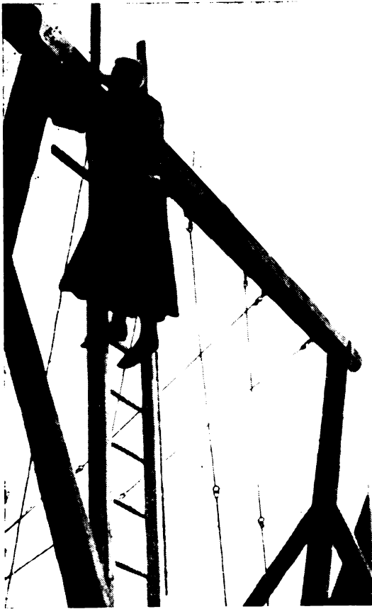
Barát mestere a szegnek, kalapácsnak.