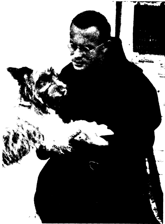
Mackó, a gyerekek játszótársa.