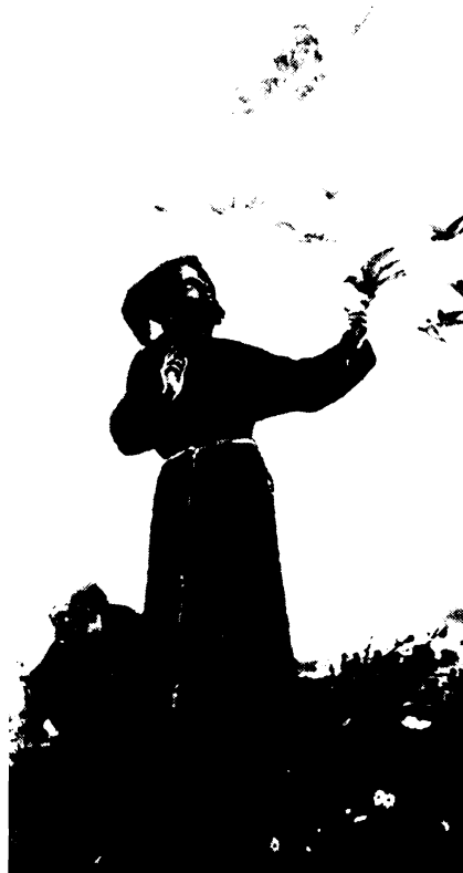
Loferini: Szent Ferenc a mennyei szemlélődés elragadtatásában.

Es azt, ha az ég besötétlik, a föld dübörgő nyögéssel megremeg, ha a vörviharban roncsolt ember-testek csonkjai hevernek szerteszét, (gyilkolnak ma minket, Uram, irtják nepedet, de ez a háború, -- mondják: bár ugy-e büntetésből Te vetted el a gonoszak eszt?) engedd, kerlek, hogy en ma és minden