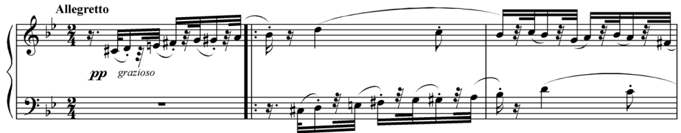
2b kotta. Dohnányi: Variációk és fúga G. E. témájára – a 7. variáció kezdete (© Ludwig Doblinger, Wien)

hogy az egész írás retorikáját sajátos kettősség határozza meg, azaz Kodály a szókimondó, sőt sokszor kíméletlen és gúnyos kritikát egy-egy kedvezőbb megjegyzéssel ellentételezte. Feltételezte (vagy tudta?): Emma nem ért vele egyet. Már az első bekezdésben ezt írja (persze aztán mégsem tartja magát ezen elhatározásához): „No de most nem mondom többet, – tekintve hogy véleményünk nem egyezik, és az eltérő véleményemet nem tudom ebben a percben olyan szépen megmondani, hogy ne essen rosszul.” 24