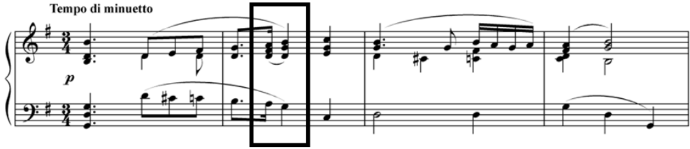
2a kotta. Dohnányi: Variációk és fúga G. E. témájára – a téma pontozott ritmikus motívuma