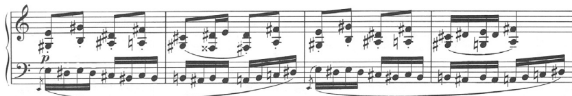
1b kotta. Dohnányi: Tolle Gesellschaft a Winterreigen című ciklusból, 52–55. ütem (© Ludwig Doblinger, Wien)