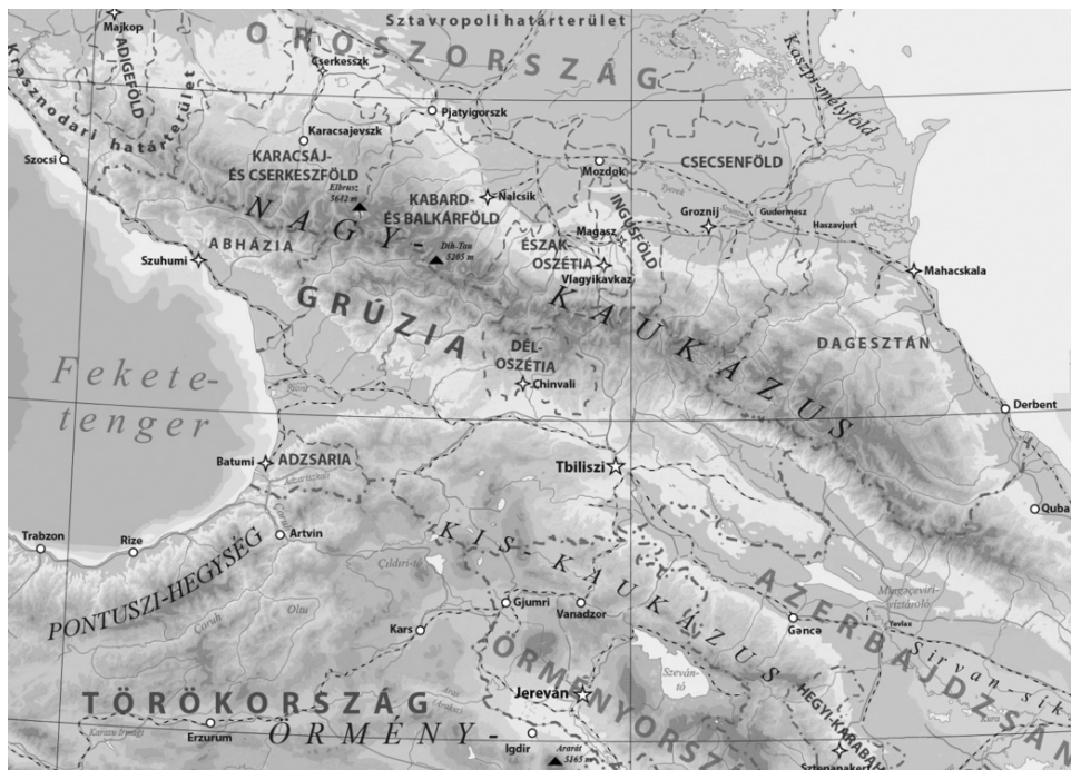
1. kép. A vizsgált terület térképe (Karacsáj- és Cserkeszföld, illetve Kabard- és Balkárföld)

A karacsáj dallamok többségének osztályozását megkönnyíti, hogy a dallammozgásuk közös jellegzetességeket mutat. Jellemző az ereszkedő, illetve emelkedő-ereszkedő sor, a soron belül pedig az egymás melletti hangokon haladó konjunkt és a záróhang alá nemigen lépő, autentikus dallammozgás. Ugyancsak jellemző az ereszkedő dallamszerkezet, melyben az egymást követő sorok egyre alacsonyabb hangsávokban mozognak. (Ugyanakkor az első sor elején nem ritka az alaphangról vagy környékéről történő felugrás, és előfordulhat egy középső hang körüli fel-le mozgás, egy gerinchang körbejárása is.) A fent felsorolt közös tulajdonságok biztosították, hogy az osztályokon belül a kadenciák szerinti (látzólag formai) csoportosítás az esetek túlnyomó többségében hasonló dallamokat hozzon egymás mellé. (A zenei osztályokat lásd az 1. táblázatban.)