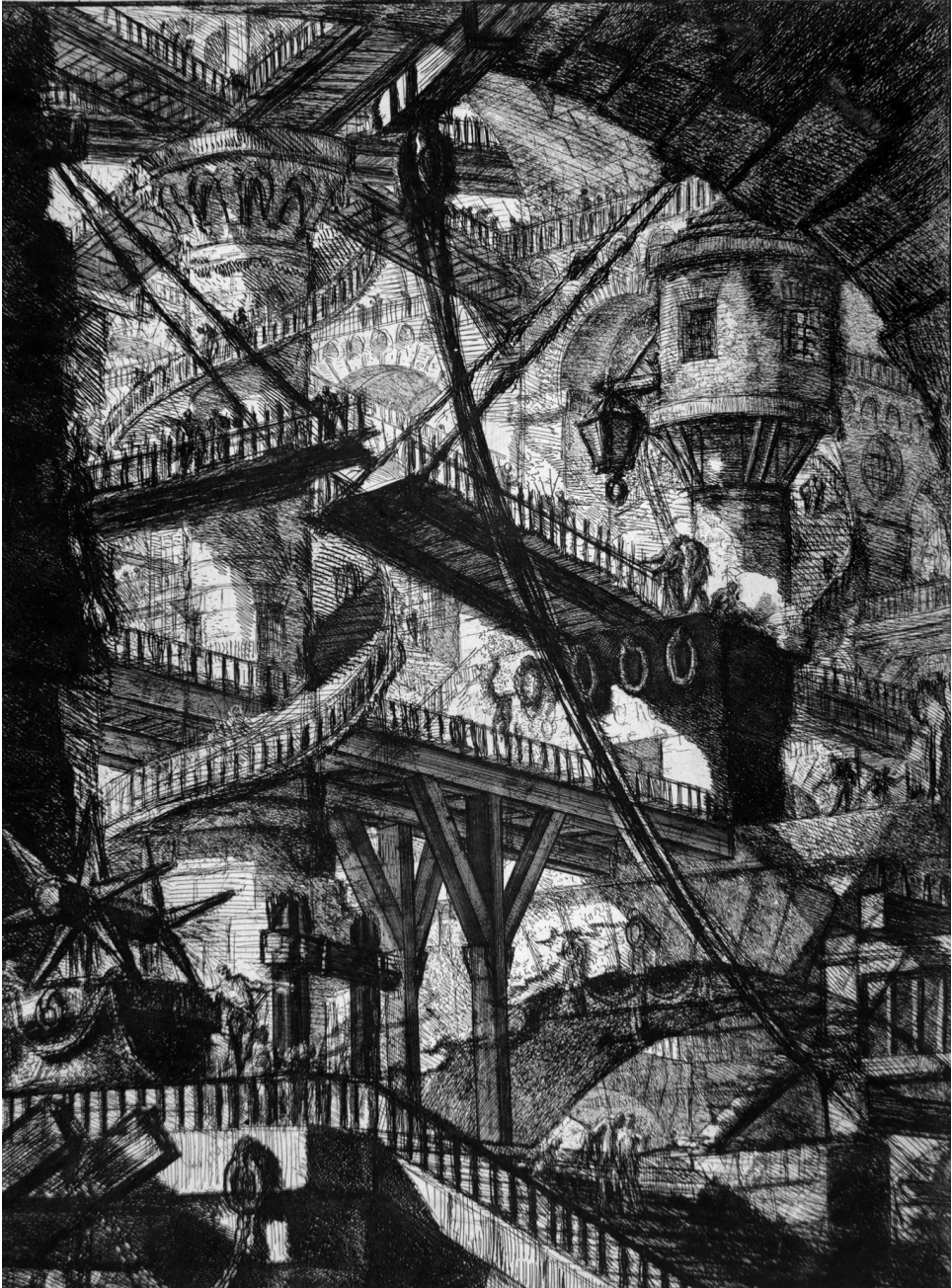
1. kép. Giambattista Piranesi: A felvonóhid (a Carceri d'invenzione sorozatból, 1749–50)