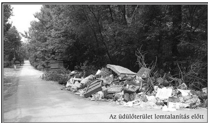
Az üdülőterület lomtalanítás előtt