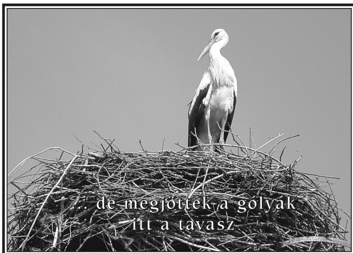
de megjötték a golyak itt a tavasz