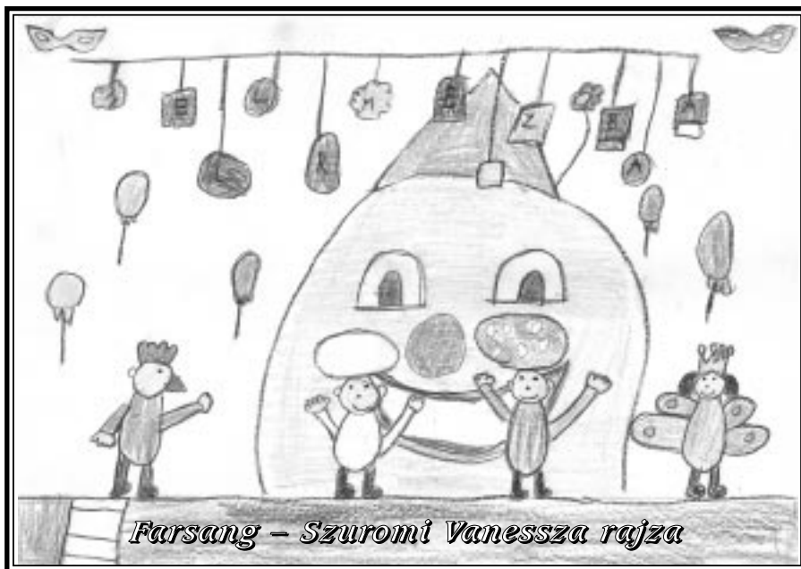
Farsang – Szuromi Vanessza rajza