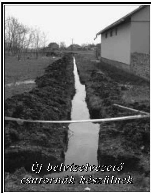
Új belvízelvezető csatornák készülnek

„Újjá kell építenünk a nemzetet szolgáló államot” (Deutsch Tamás)