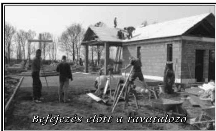
Befejezés előtt a ravatalozó