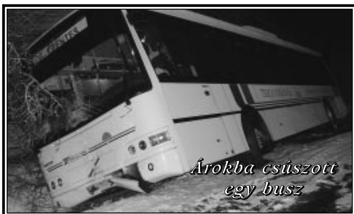
Árokba csúszott egy busz