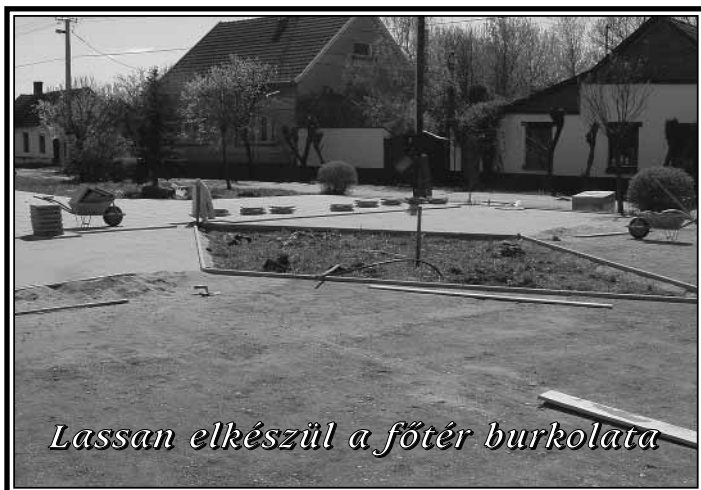
Lassan elkészül a főtér burkolata