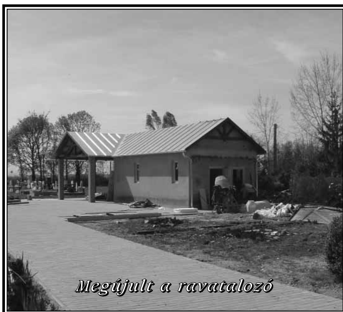
Megújult a ravatalozó