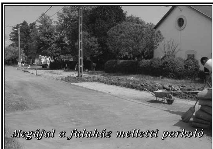
Megújul a faluház melletti parkoló