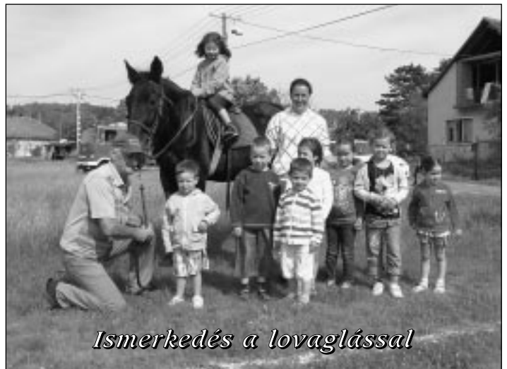
Ismerkedés a lovaglással