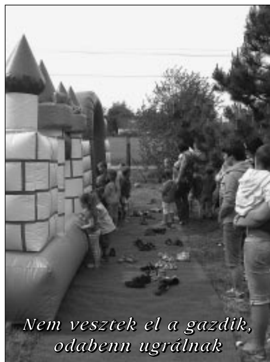
Nem veszték el a gazdik, odabenn ugrálnak