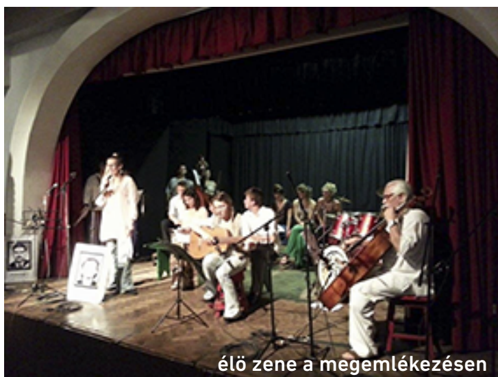
élő zene a megemlékezésen

Végül Gorondi Gábor: „Mert a magyar ilyen: mint fényes napsugár: a viharokon is átvág, mint Te meg Én!”