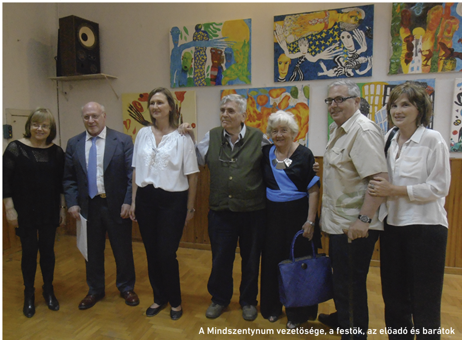
A Mindszentynum vezetősége, a festők, az előadó és barátok

Acaso quiere transmitirnos que hay una crucifixión que debemos aceptar y es que nunca entenderemos el sentido de la vida. Las imágenes transmiten esperanza. Nos dicen que hay que emprender el camino. Nos dicen que podemos quebrar el encanto ruinoso que nos acecha. Que si consagramos el saber al espíritu, podemos recuperar la libertad, podemos regresar del exilio y de la muerte del alma. Finalizada la conferencia se ofreció un brindis y luego una cena típica húngara para los que deseaban seguir compartiendo.