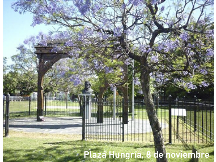
Plaza Hungría, 8 de noviembre