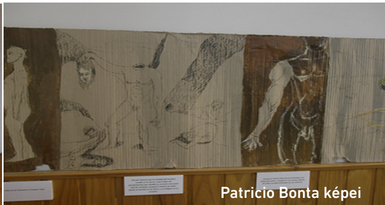
Patricio Bonta képei

Con su pintura indaga en nuestras búsquedas, en la angustia del destino, en nuestros dolores y en la salvación. Monstruos alegres, insectos gigantescos, se apoderan de nuestro mundo indefenso y muestran las verdaderas bestias apocalípticas que viven en nuestro interior y están al acecho, para esclavizarnos y colonizar nuestra conciencia. Sus nuevas imágenes reflejan a ese libro mágico, la Biblia, a donde está nuestra creación y nuestro origen y el mensaje de Dios a través de los evangelios.