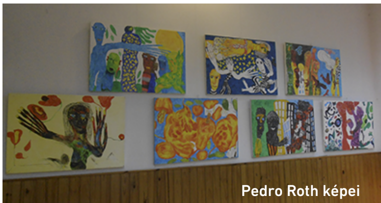
Pedro Roth képei