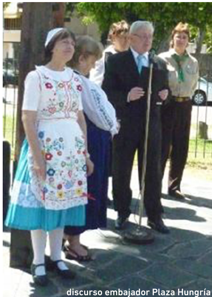
discurso embajador Plaza Hungría

El día 23 de Octubre amaneció como cualquier día gris y otoñal en el paraíso socialista. Nadie se imaginaba que ese día quedaría para siempre en la historia, y marcaría nuestras vidas hasta el último día. El ambiente en general estaba enrarecido. Los polacos exigían en las calles cambios en el sistema. Los universitarios en Budapest organizaron una manifestación en su apoyo, con la participación de los obreros y trabajadores de las fábricas, preparando un petitorio de 16 puntos donde se exigía el retiro de las tropas soviéticas, libertad de palabra, independencia económica y neutralidad con respecto a los dos bloques en pugna. Todo se realizó pacíficamente, hasta que la multitud llegó al edificio de la radio, pidiendo la transmisión de los 16 puntos. Acá se disparó por primera vez contra los manifestantes desarmados. Los acontecimientos se precipitaron con una velocidad increíble. El ejército abrió los arsenales, el pueblo se armó y empezaron los combates con la policía política militarizada. El gobierno títere vio, que se quedó sin poder de fuego, pidió la intervención soviética, invocando el pacto de Varsovia de defensa mutua. A medianoche ya era una guerra total entre el pueblo armado con fusiles y granadas contra el ejército más poderoso del mundo.