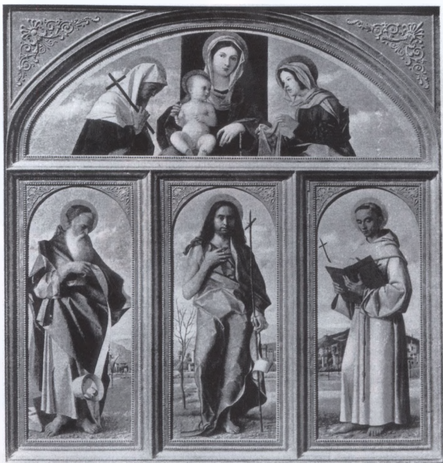
Giovanni Bellini e bottega: Trittico di San Cristoforo della Pace. Già Berlino, Kaiser Friedrich Museum

uno dei membri della famiglia di pittori Santacroce, trasferitasi a Venezia dal bergamasco. 5 Da un lato, la firma «HIERO», leggibile nell'angolo inferiore destro, dall'altro il fatto biografico che Girolamo da Santacroce lavorò per un periodo come aiuto di Giovanni Bellini, sostengono tale attribuzione, ma genera qualche perplessità che le firme veramente autentiche indichino sempre il nome completo e l'anno, anzi talvolta specificino anche il mese e il giorno nel quale è stato terminato il lavoro, inoltre nessuna delle opere così firmate presenta indubbie ed evidenti affinità stilistiche con il Battista di Budapest. La data più vecchia a noi nota è quella del 23 ottobre 1516, riscontrabile sulla composizione della Madonna col Bambino dell'Art Institute di Chicago. Anche tale Madonna del museo americano è di derivazione belliniana, le debolezze del disegno e della modellatura la inseriscono