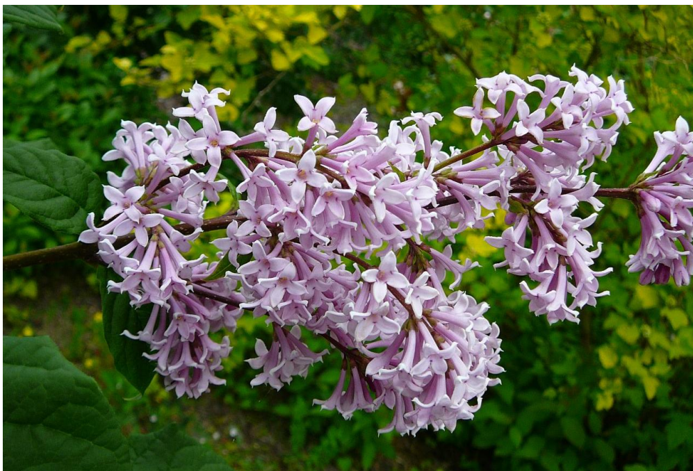
1. kép. A Jósika orgona.

A grófnő részese volt egy új növény felfedezésének. Egy Bethlen Katalin kolozsvári kertjéből kapott ismeretlen orgonát Csáky Rozália küldött el Bécsbe, ahol megállapították róla, hogy új cserje. Báró Franz Joseph Jacquin bécsi egyetemi tanár róla nevezte el a növényt Jósika orgonának ( Syringa josikaea Jacq.). 55 1830-ban a Nemzeti Társalkodó adott hírt az eseményről, a következőképpen: „ A Németországi Természetvizsgálóknak és Orvosoknak az idén Szeptemberben Hamburgban tartott gyűléseken, több megszárazott plánták közt Bétsi Professor B. Jacquin Ur, elő mutatta a' Syringa-nak egy ujj nemét, melynek felfedezését a Botanika Erdélyi Kormányzói rendes Elölülő B. Jósika János ur ó Extzja, ezen tudományban különösen gyönyörködő az egész Ország előtt tiszteletben álló hitvesének, Gr. Csáky Rosália Úr asszony Ó Extzjának köszönheti. A' plánta tiszteletül, 's emlékezetül Syringa Josikaea nevet kapott, 's rajzolatban is meg fog jelenni. ” 56 Az orgonafaj feltalálási helyei között Kolozs, Máramaros és Bihar vármegyei helyeket soroltak fel, többek között Csáky Rozália sebesi (Kolozs megye) birtokát. 57 Első ábrázolása 1831-ben jelent meg. A felfedezés értékére utal, hogy még 2014-ben is botanikai disszertáció született róla A Jósika orgona aktuális és történeti biogeográfiája címmel a Budapesti Corvinus Egyetem Kertészettudományi Doktori Iskolájában. 58