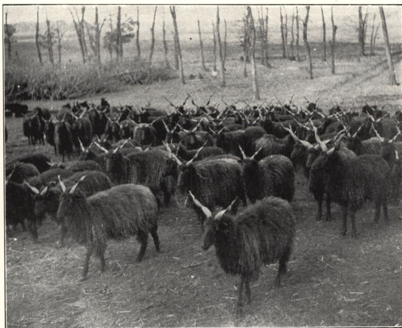
Altungarische schwarze Schafherde aus unvermishtem Geblüt im Winter auf der Waldweide von Bánk bei Debrecen. Die Tiere haben aufrechtstehende, gewundene Hörner und langes zottiges Vlies.