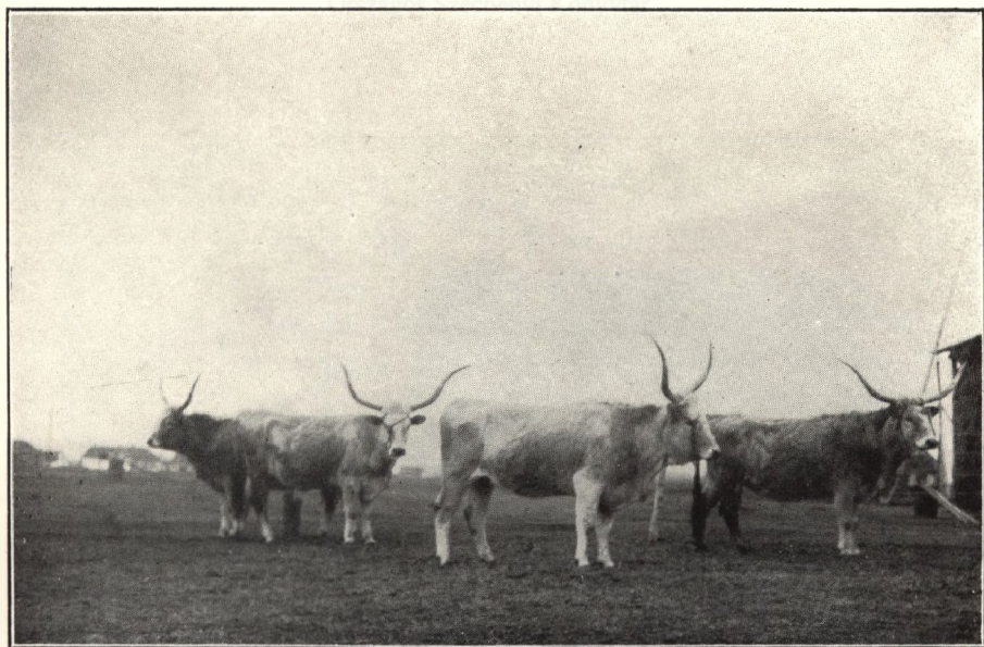
Ungarische Kühe aus der Herde der Stadt Debrecen.