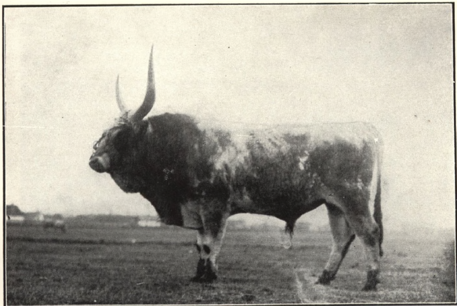
Ungarischer Stier auf dem Hortobágy aus der Rinderherde der Stadt Debrecen.