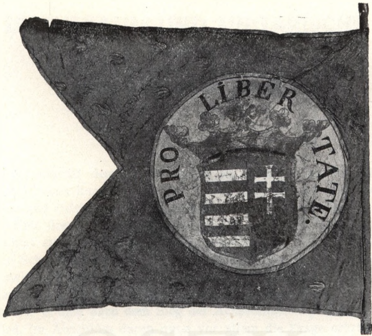
Fabne Franz Rákóczi II. Ung. Nationalmuseum