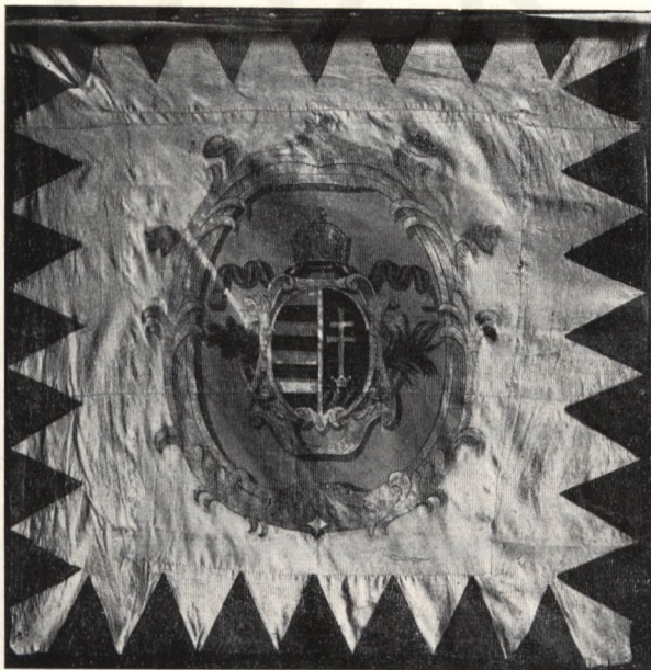
Ungarische Fabne aus dem Freiheitskrieg 1848—49. Ung. Nationalmuseum