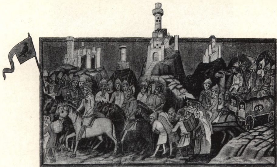
Ungarische Fahne mit dem Aar aus der „Wiener Bilderchronik“