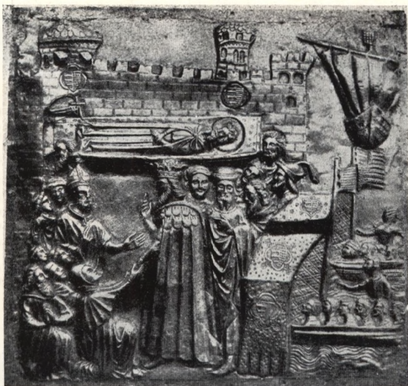
Gestreifte Fabne vom Silbersarg des hl. Simon von Zara