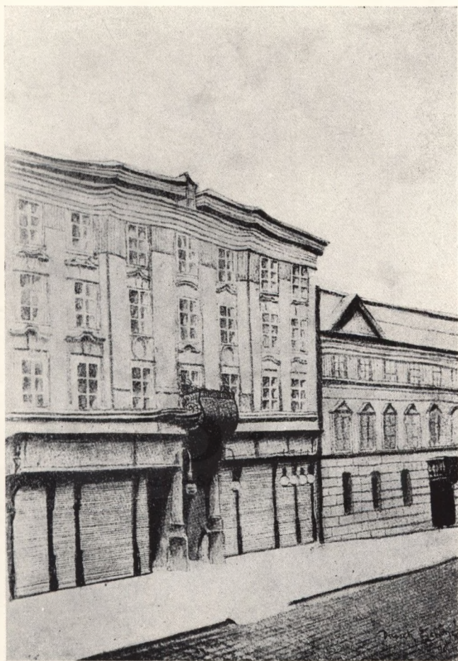
Széchenyi's Geburtsbaus in der Herrengasse