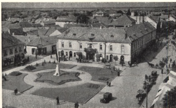
Hauptplatz mit Gasthof zum Goldenen Löwen