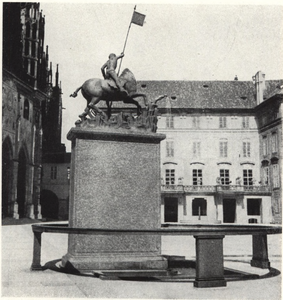
Das Reiterstandbild mit dem heutigen Sockel