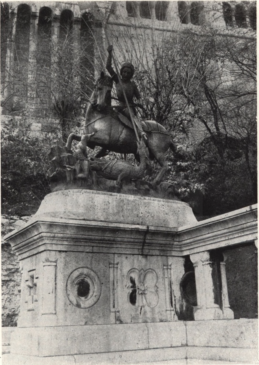
Kopie des Reiterstandbildes an der Fischerbastei in Budapest