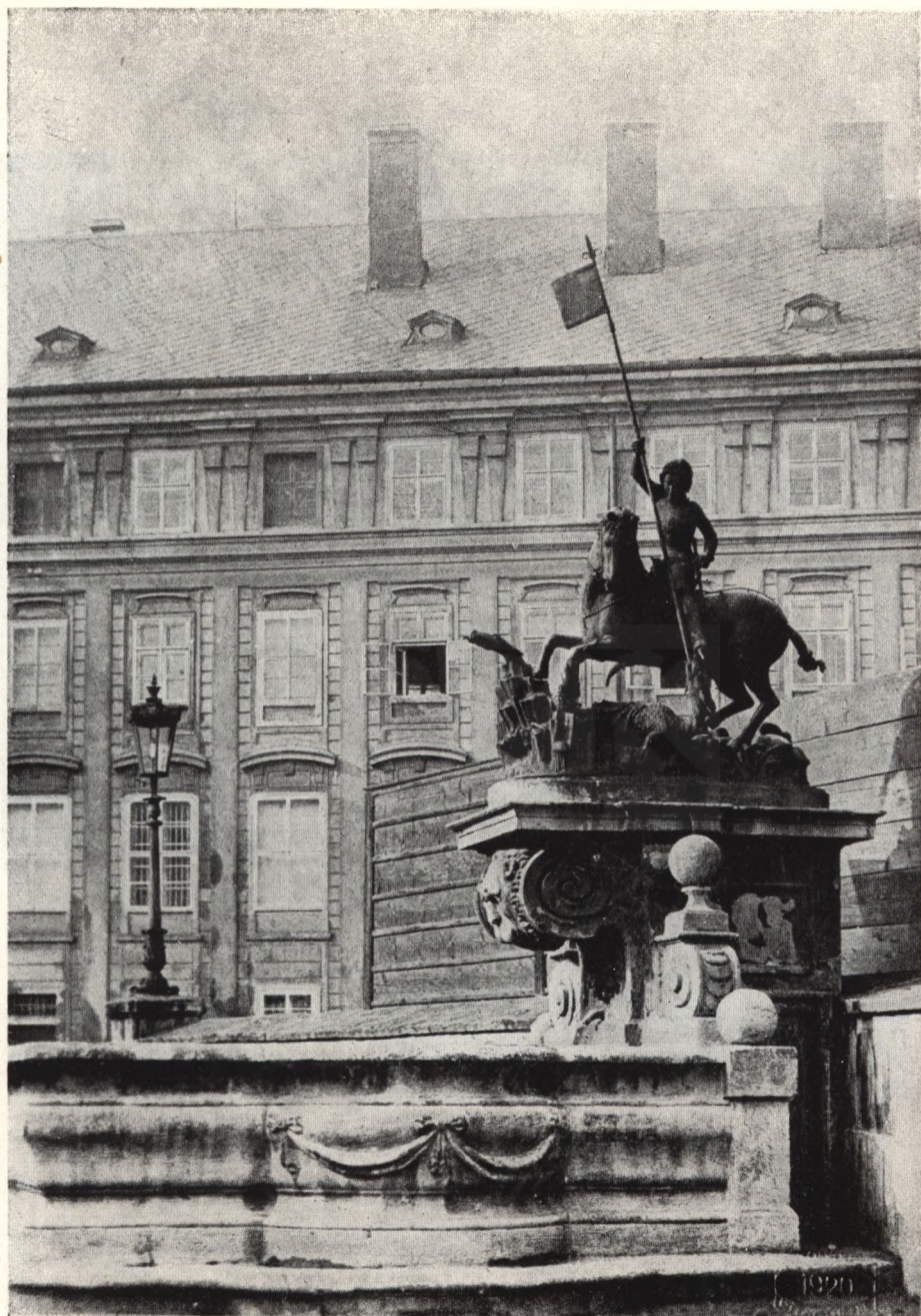
Das Reiterstandbild mit barockem Sockel