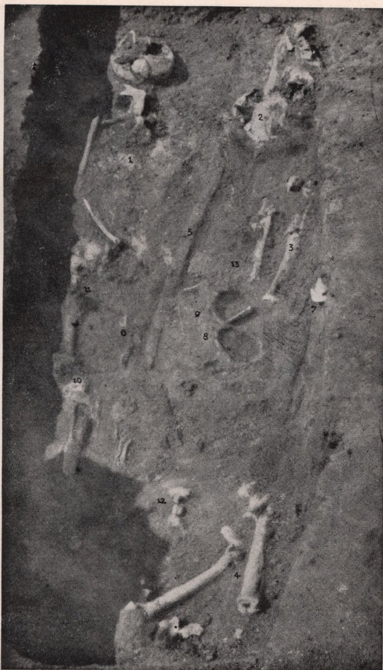
Abb. III. Grab Nr. 10. des Friedhofes in der Zápolya-Strasse zu Kolozsvár (Klausenburg).