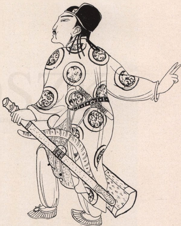
Abb. II. Uygurischer Krieger des 9. Jh.-s auf den Wand- gemälden von Ostturkestan. (Nach Le Coq.)