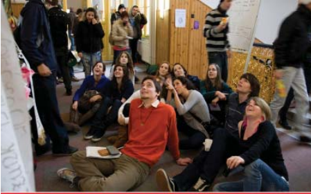
Egy mosoly megváltoztathatja a napodat.