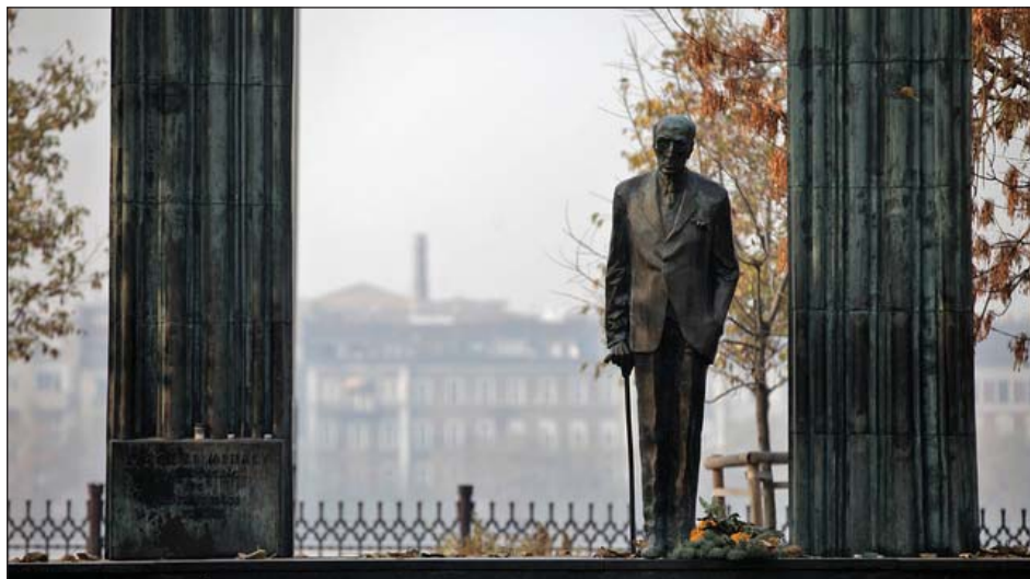
Károlyi Mihály szobra