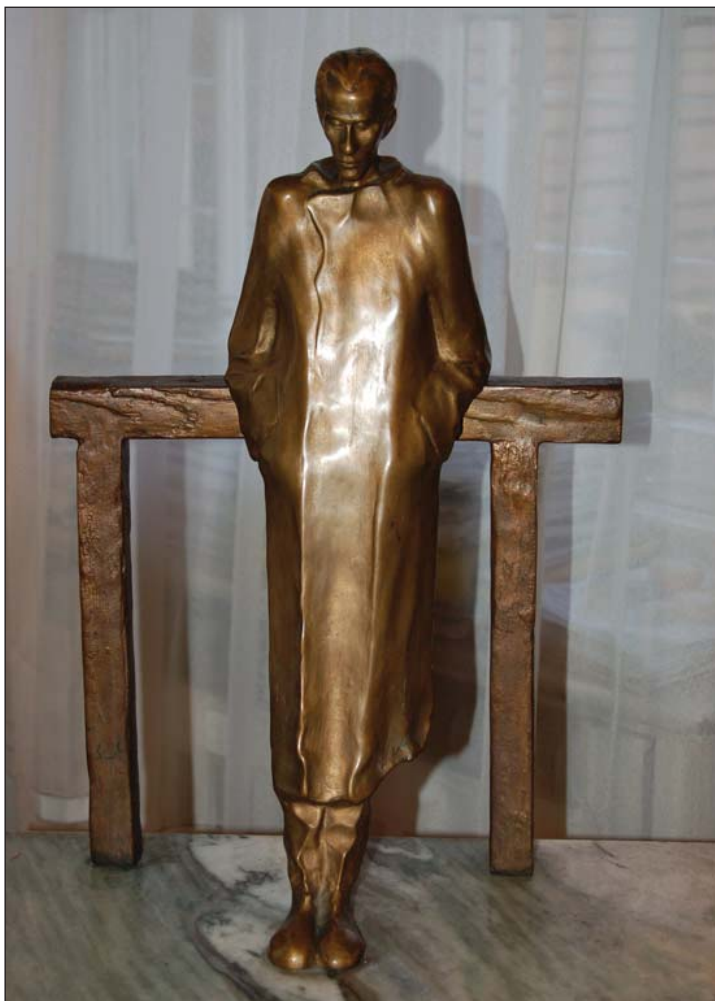
Radnóti Miklós szobra Örkény István lakásában