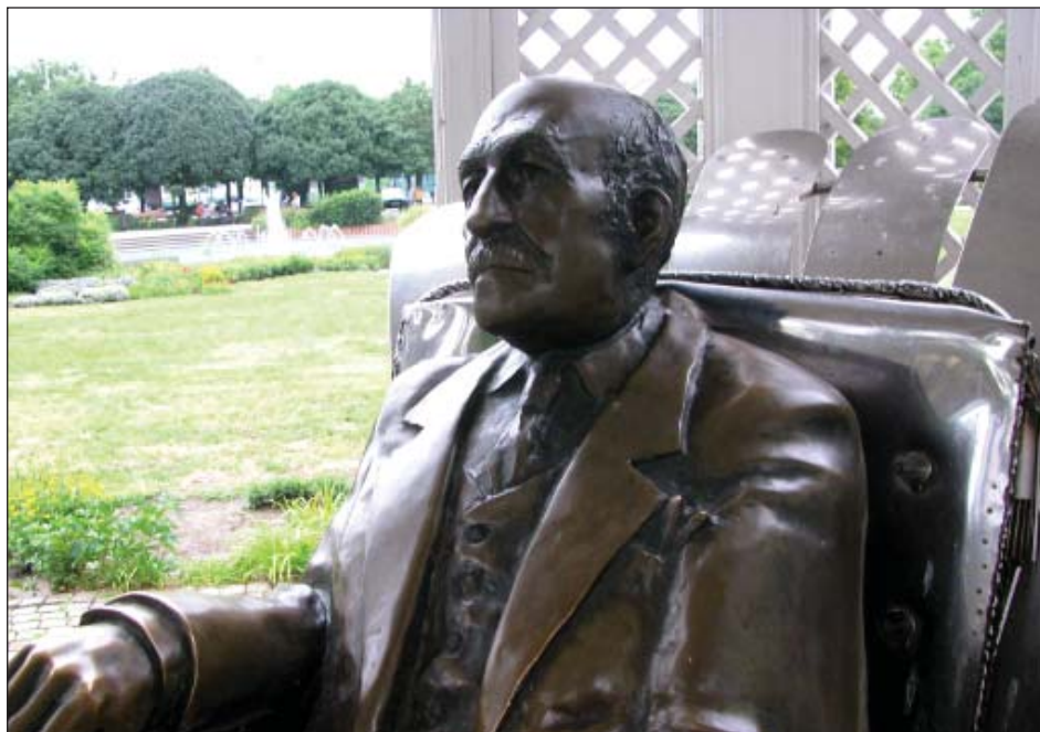
Kálmán Imre szobra