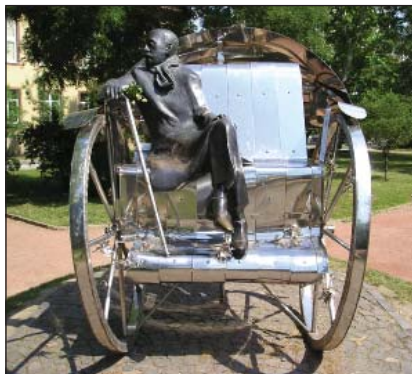
Krúdy Gyula szobra