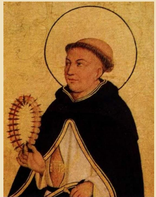
B. ENRICO SUSONE, † 1366 23 gennaio, sacerdote