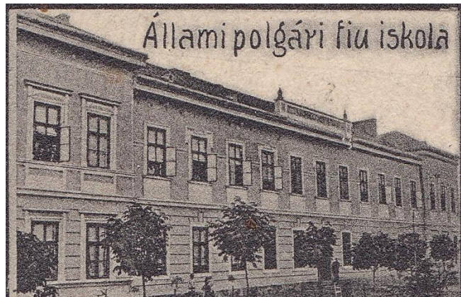
Korabeli képeslap részlete