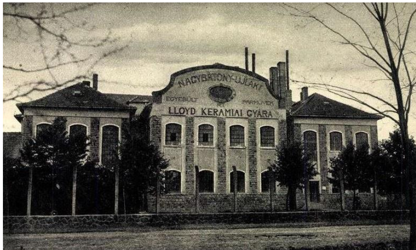
Nagybátony-Újlaki Egyesült Iparművek Rt. Lloyd Kerámia gyárépülete

Neumann megérkezése után nagy változás állott be az üzemben, hiszen nagymértékben javult az áruk minősége. Neumann egy új típusú mázt kísérletezett ki. Szép, tetszetős színű mázzal és mintával gyártották a