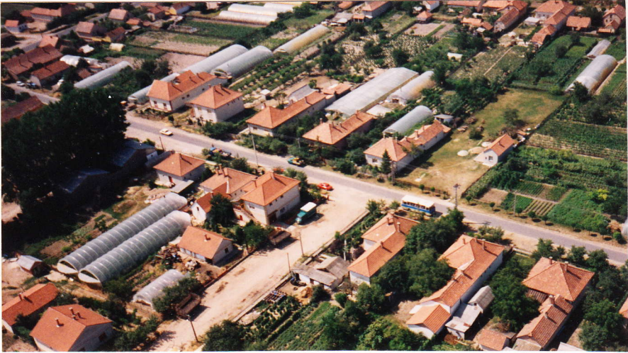
Az Arany János és Bem utcák kereszteződése