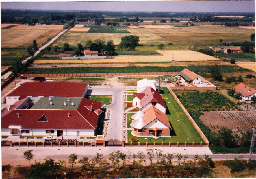
Az EUROCOOP Konzervgyár