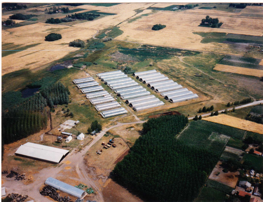
A Pálmonostora-3 Kft. fóliatelepe