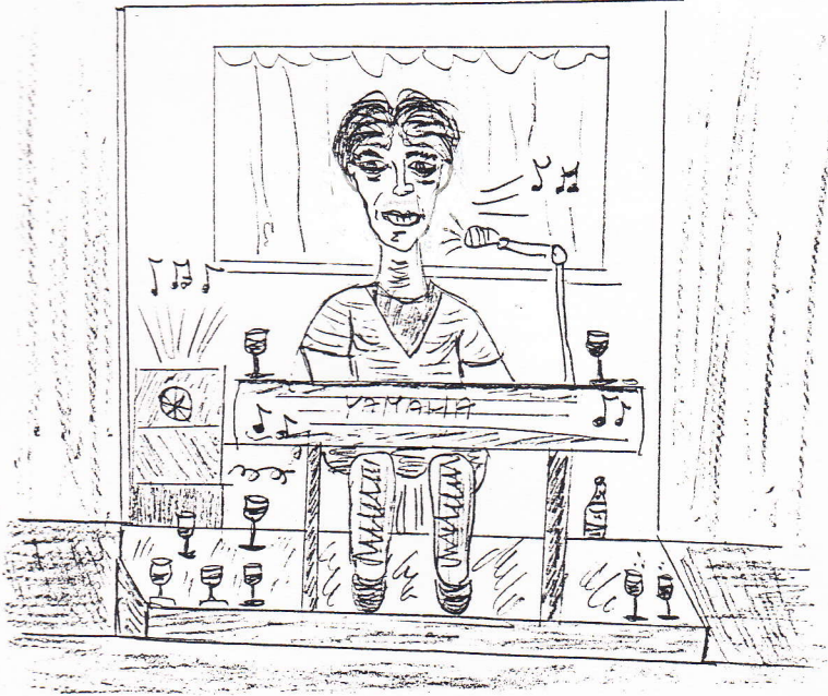
(Tarjányi István rajza)