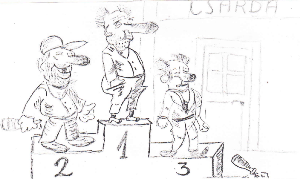
(Tarjányi István rajza)