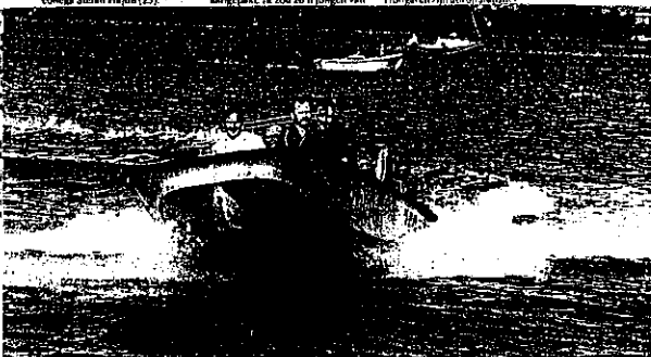
Hongaarse agenten tijdens giftvormigheid het weder op te zien hoe Nederlandse agenten met de burgers omgaan. „Bij ons wordt de politie niet gevaardeerd.”

wij dan moet jaters op.” zegt Hongaarse agent tijdens de kooptante. „Hongarije zijn dol op statistiek”