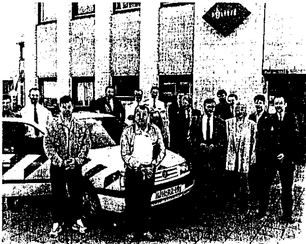
De Hongaarse gasten en hun Nederlandse collega-agenten voor het politiebureau van de Winger in Houten.

De politie van Houten had gisteren bezoek van collega's uit de Hongaarse stad Szentes. Szentes is ongeveer zo groot als Houten, maar daar houdt de vergelijking voor wat betreft het politiewerk meteen op. „De agenten en het publiek gaan hier zo vriendelijk met elkaar om. Dat is in Hongarije gewoon ondenkbaar”.