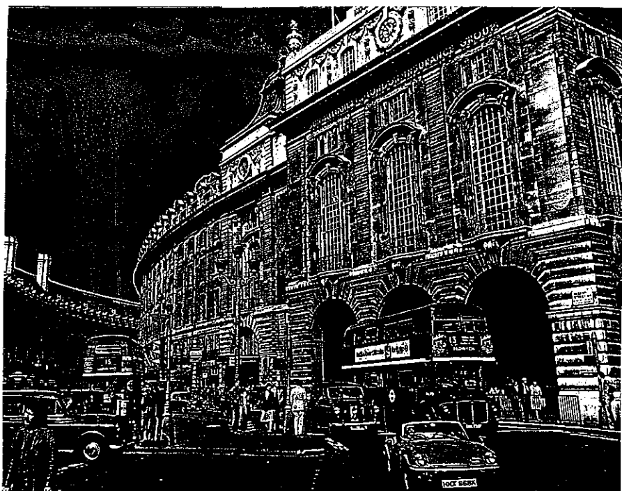
A Regent Street

A neonreklámjairól közismert Piccadilly Circus a város szívében először azzal lepi meg az embert, hogy kisebb, mint amekkorának a képeslapok alapján képzelhetnénk. Mégsem okoz csalódást, nyüzsgő forgataga, élénk színei magával ragadják a tekintetet. Az élet itt soha nem áll meg. A tér közepén egy díszes szökőkút található szárnyas