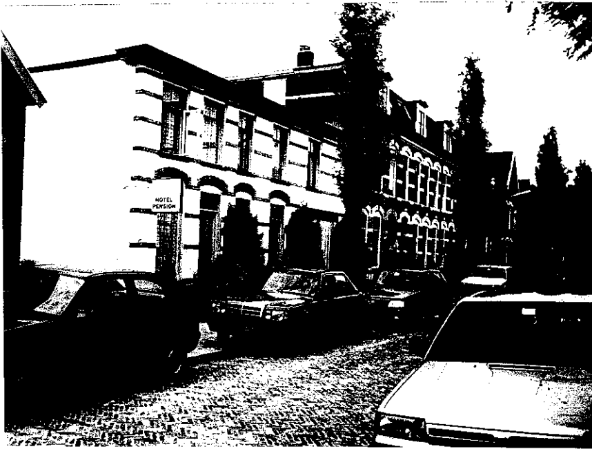
Ebben a hotelban laktunk egy hétig

angolna falatok, csirkemell tésztába sütve sültkrumplival, apró csöves kukoricosa főve. A végén jégkrém és bonbon. Közben egy pohár pezsgőt és egy pohár vörösbori fogyasztunk. A vacsora után köteletlen beszélgetés, majd ajándékozások következnek. A bennünket kísérő holland rendőröknek magyar souvenirokat adunk (rendőrségi emblémás pótló, karjelvény, Tokaji aszu, korsó stb.). 23 óra tájban térünk nyugovóra.