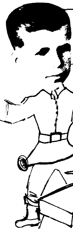
Volkovits Antal képviselő