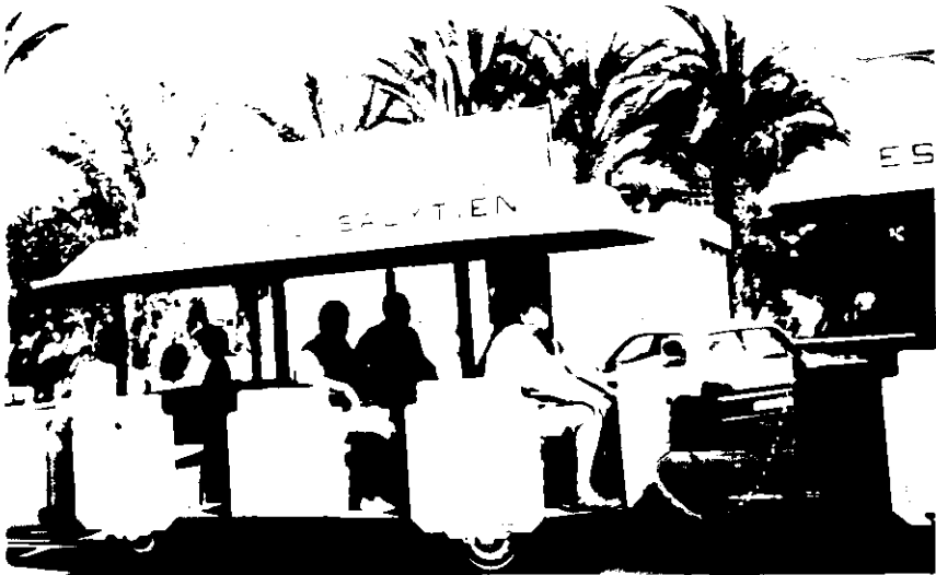
Városnézés gumikerekű "vonatból"