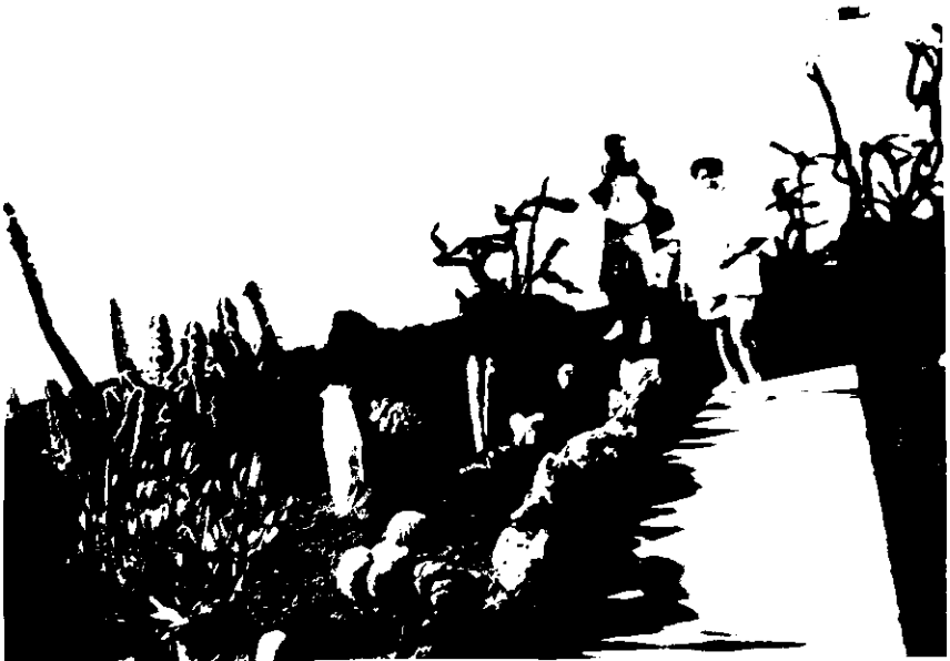
Kaktuszok minden mennyiségben