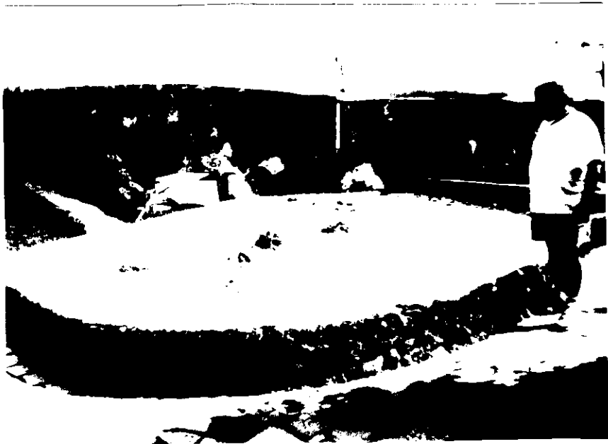
A szigetcsoport makettje