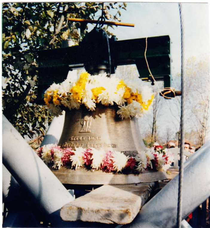
A "nagy" harang a felszerelés előtt