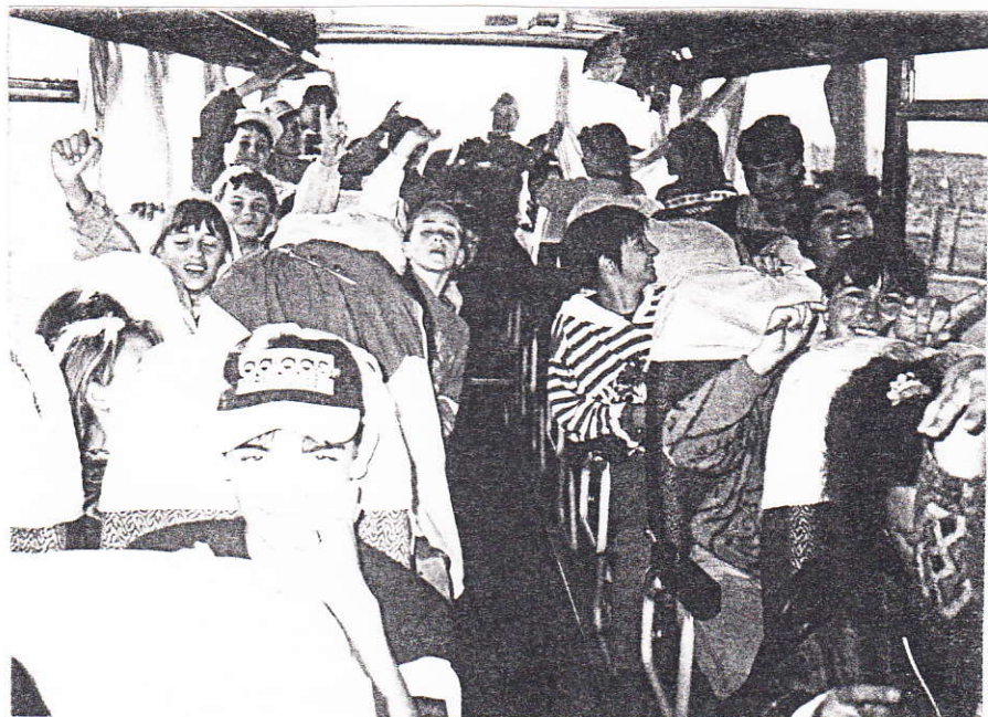
Vidám hangulat a buszon