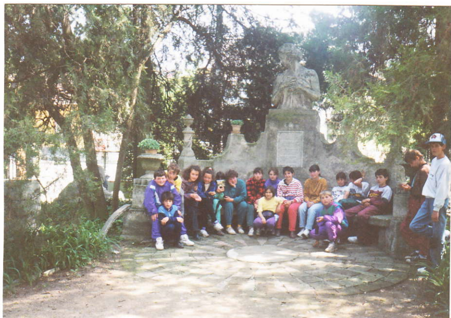
A székesfehérvári Bory-várban