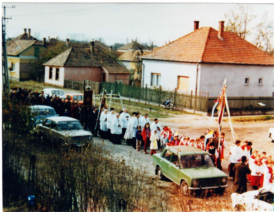
Körmenet a harangszentelés alkalmából