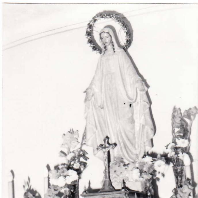
Szűzanya szobor a csengelei plébánián

Gyönyörű időben került sor az ünnepeltek által celebrált nagymisére, a hálaadásra. 50, illetve 25 év adatott meg Istent dicsérni, szolgálni, vezetni, segíteni a híveket a katolikus közösség táborában.