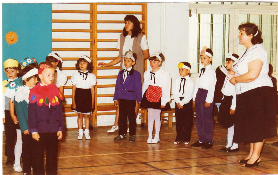
A búcsúzó óvodások műsorából