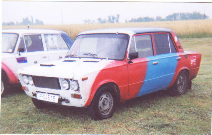
A bajnok versenygépe