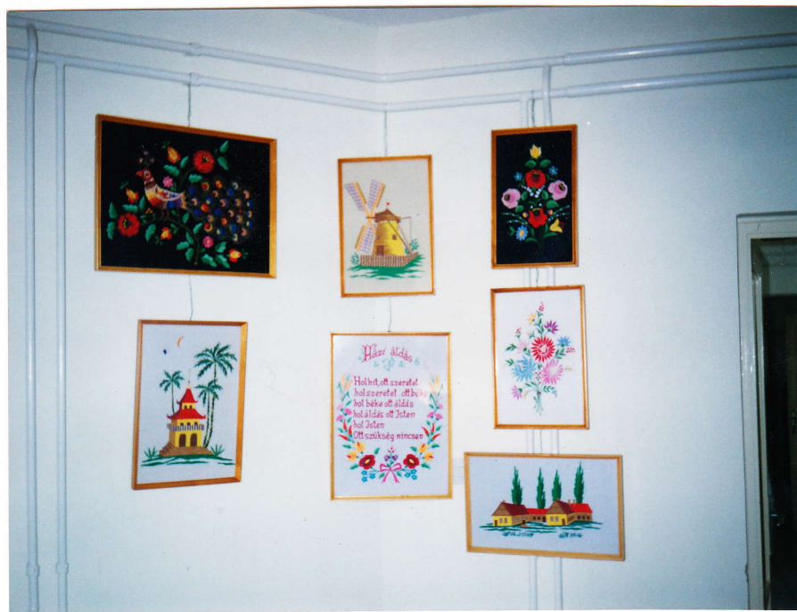
Kővágó Györgyné kiállításának részlete