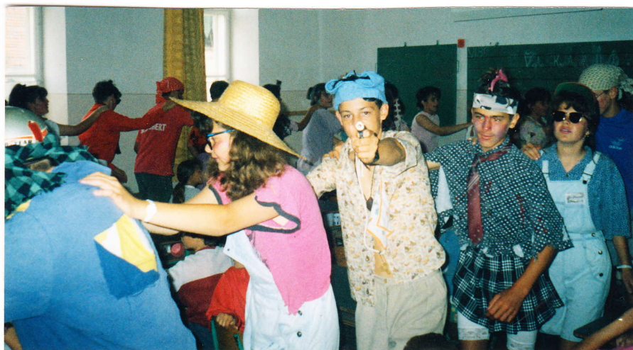
Ez még "bolondballagás" volt

Sok szerencsét kívánunk új iskoláitokhoz és sok boldogságot további életeitekben!