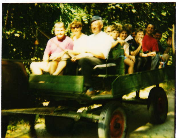
Lovaskocsival az erdőben