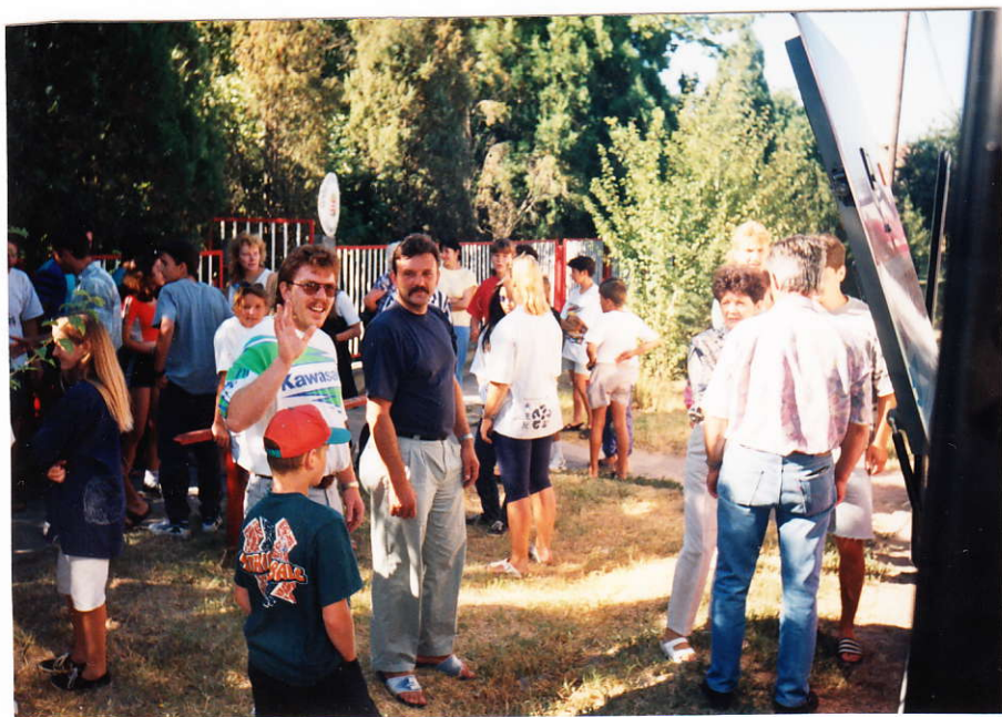
A búcsúzás pillanatai