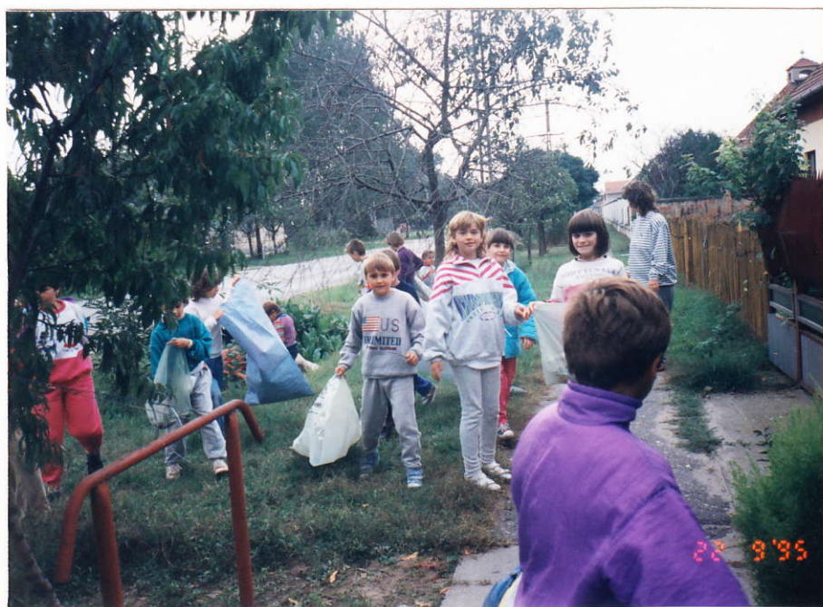
Munkában a "szüretelők"