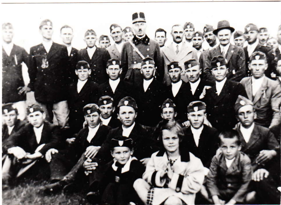
Csengelei levétek az 1930-as években

megállapítható, hogy 1930-ban ugyan nem, de 1931-ben 2, 1932-ben és 1933-ban 5-5, 1934-ben 4, 1935-ben és 1936-ban 1-1 bálát tartottak. A Csengelei Mezőgazdasági Egyesület 1942-ben egy rádió készüléket ajándékozott a levétek számára.