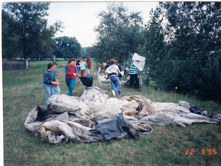
A "szüreti" termés

Az esztendő egy napjában az emberiség összefog és közös erőfeszítéssel teszik szebbé környezetüket.