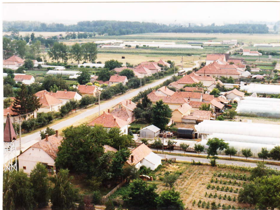
A Május 1. utca labdarúgópálya felőli része