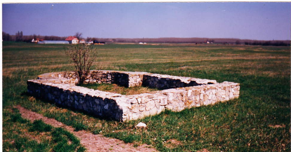
A Bogár-tanya melletti templomrom

Építmény: A legrégebbi épületmaradvány a Bogár-tanya melletti templomrom, mely legkésőbb az 1200-as évek végén épült. A legöregebb ma is álló épület az általános iskola udvarán álló öreg iskola, mely 1896-ban készült el. A legmagasabb építmény a víztorony (39 m).