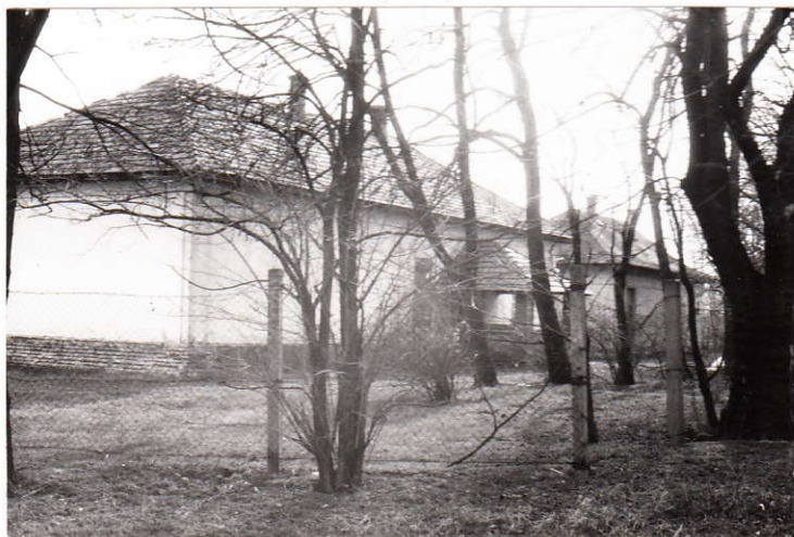
A Templomhalmi iskola

Iskola: A belső-csengelei iskolában kezdődött meg legkorábban a tanítás, 1896-ban. A tanyasi iskolák közül elsőként a Templomhalmi iskolát szüntették meg 1973-ban. Az utolsó külterületi iskolaként az Erdősarkai szűnt meg 1995-ben.