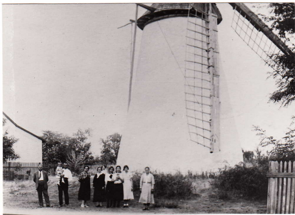
A Kordás-féle szélmalom

Szélmalom: Az első szélmalmot Kordás Mihály építette. Az építés dátuma nem ismert, de 1887-ben már állt.