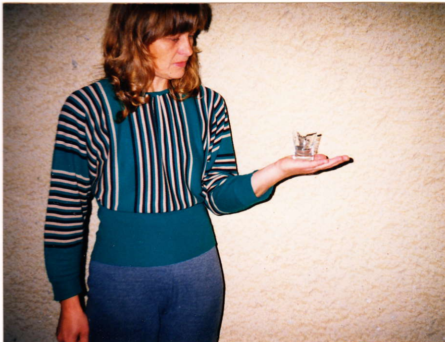
Az óvoda játszóterén talált törött üvegpohár