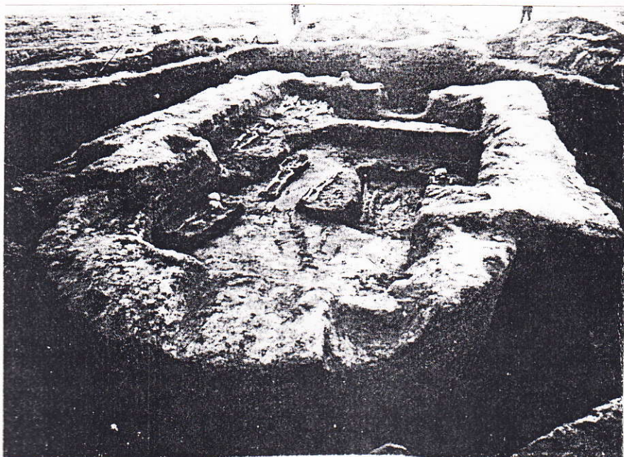
A templomrom feltárás közben

Öt esetben a temetés ünnepi ruhában történhetett, amire az előkerült selyemszövet darabok, párták és pártaövek utalnak. Pártát három gyermeksírban fedeztek fel. Pártaöv 3 sírból került elő, ezüstözött bronzveretekkel. Az egyik öv szíjvégén a páncélba öltözött Szent Györgyöt ábrázolták, amint a sárkány torkába dőf lándzsájával és a lábával rátapos. A szent itt gyalogosan szerepel, ellentétben a középkorban elterjedt lovas ábrázolástól.