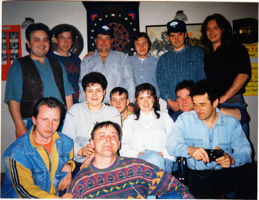
A Csengele-Béketelep bajnokság résztvevői

1039 pontot értek el. A következő mérkőzésen újra a mieink nyertek 1127 ponttal, szemben a szegediek 883 pontjával. Az utolsó forduló igen szorosra sikeredett. Végül a Koronások 926 pontot értek el, a Joó kiskocsmá versenyzőinek csak 894 pontot sikerült dobni. Így a Korona söröző csapata 3:1-es eredménnyel elnyerte a várdordíjat és az a következő bajnokságig a helyi sörözőt díszíti.