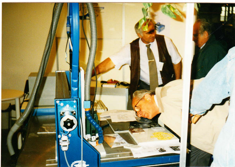
Sokan érdeklődtek a gépről