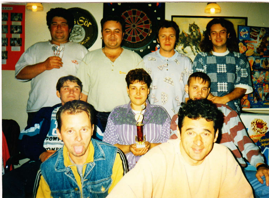
A bajnokság harmadik fordulójának résztvevői