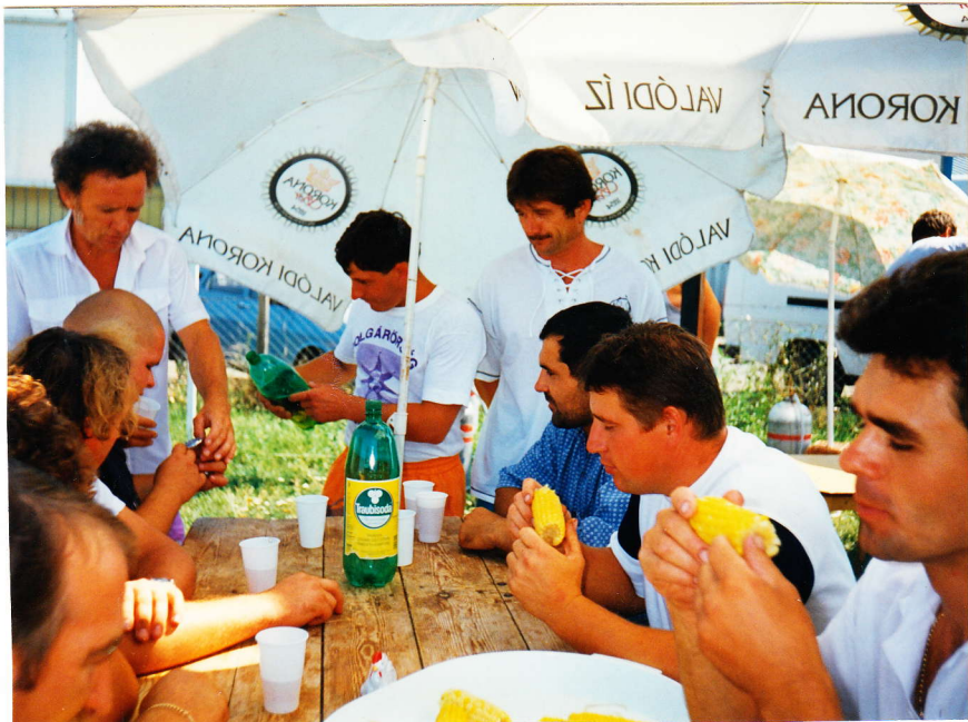
Jól fogyott a főtt kukorica és a csapolt sör is