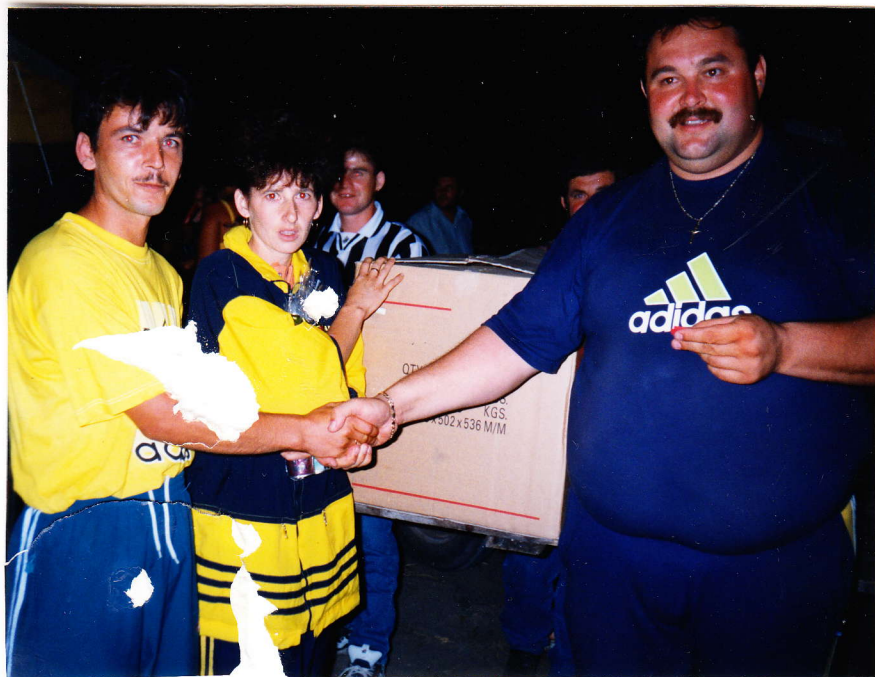
A tombola fődíjának nyertesei

A nyitott oldalú sátorban elfogyasztott vacsora és a tűzijáték közötti idő viszonylag eseménytelenül telt el. A felüdült vagy elkábult emberek kisebb-nagyobb csoportokba verődve tereferéltek, sétáltak; célba lőttek-dobtak; csemetéiknek vették a kissé drága