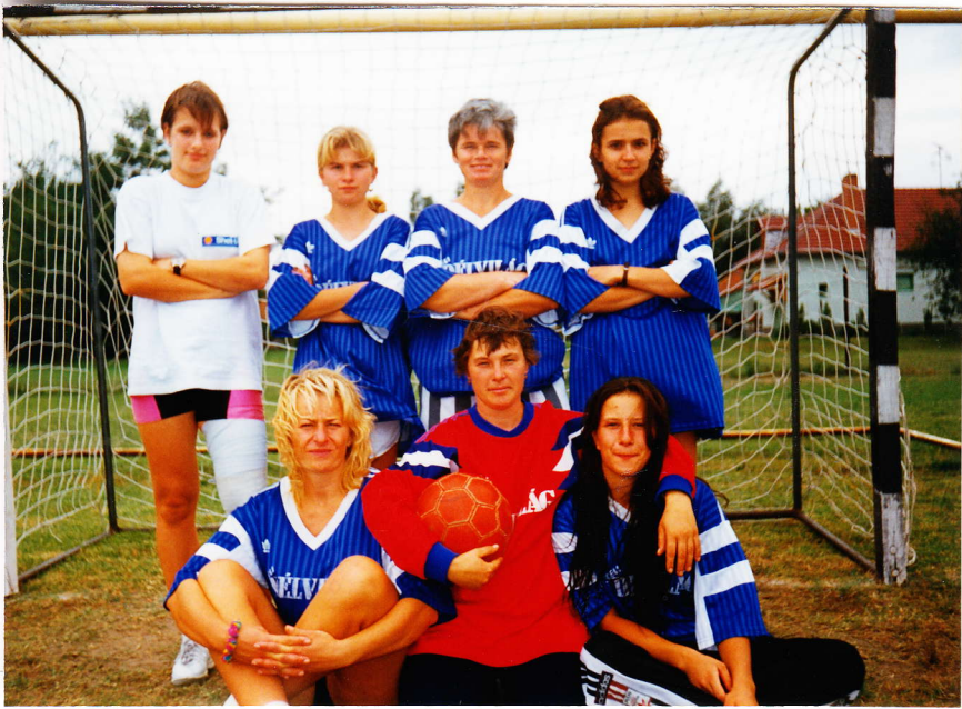
A leány focistáinknak most csak a harmadik helyre futotta

Mucsi Ferenc. Eredményeik: Víghadó-Csengele - Kiszombor 6:3, Víghadó-Csengele - Üllés 1:2, Víghadó-Csengele - Ásotthalom 2:0 (az összes csengelei gólt ifj. Vígh szerezte).