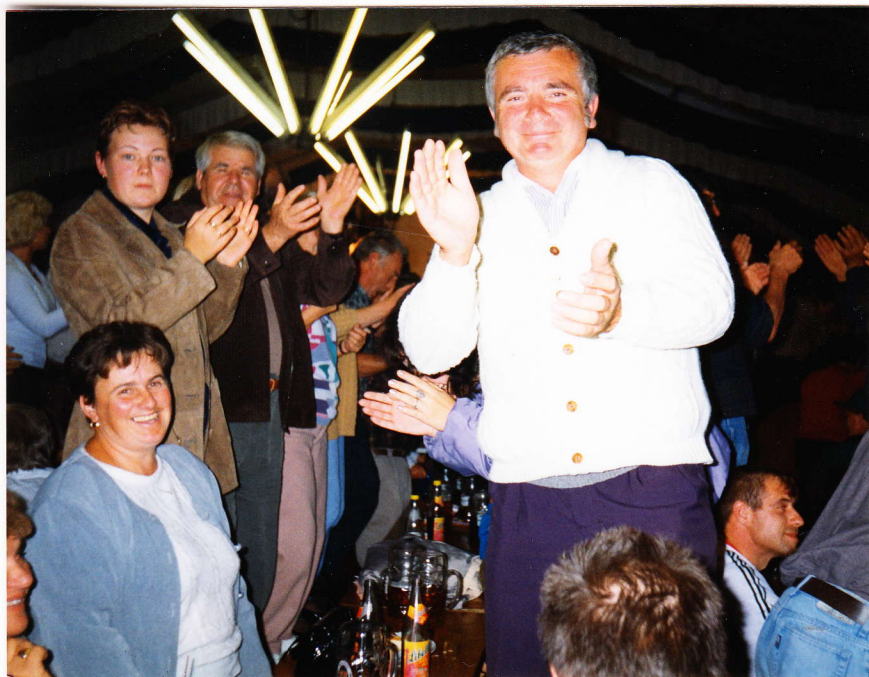
Vidám volt a hangulat a sörsátorban

Elnézést kérek a kis kitérőért, de úgy gondolom, szorosan csatlakozik a előbbi mondandóm az ott látottakhoz, tapasztaltakhoz. Kívánom, hogy minél több csengelei ember engedhesse meg magának, hogy eljuthasson egy fejlett országba, mert amit lát és kézzelfoghatóan tapasztal az ember, annyival mindig gazdagabb a tudata és mindezeket valahol hasznosítani tudja.