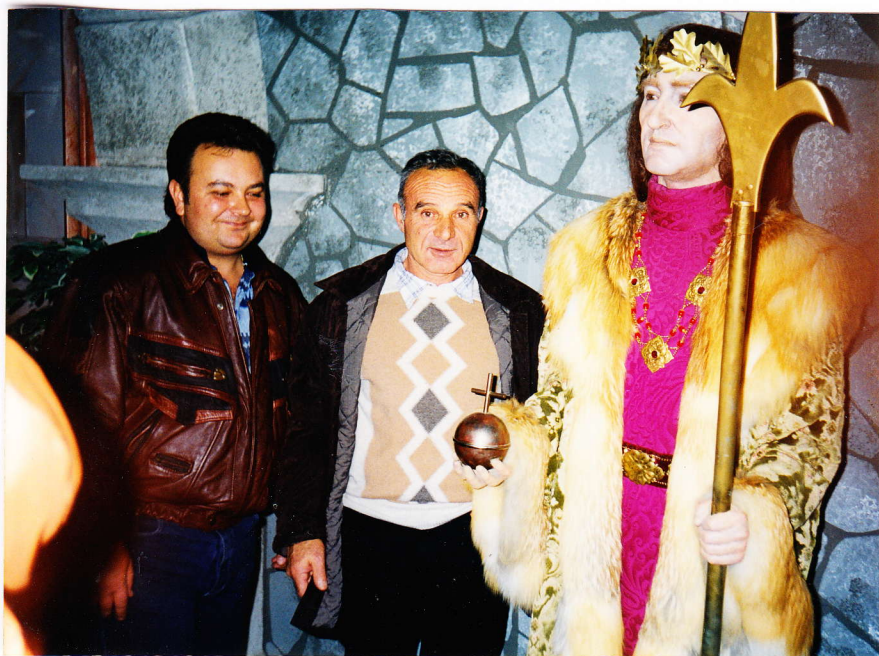
A vendéglátó és Mátyás király társaságában