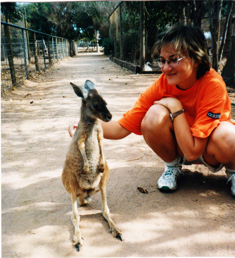
Ausztrália nemzeti állatával, egy kis kenguruval

bankba, leülnek a földre, míg várakoznak. A vonaton földön utaznak, persze szőnyegezettek a vonatok. Bárhová bemennek szakadt ruhában.