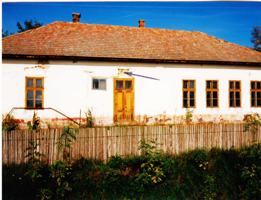
Jól látható az emléktábla eredeti helye