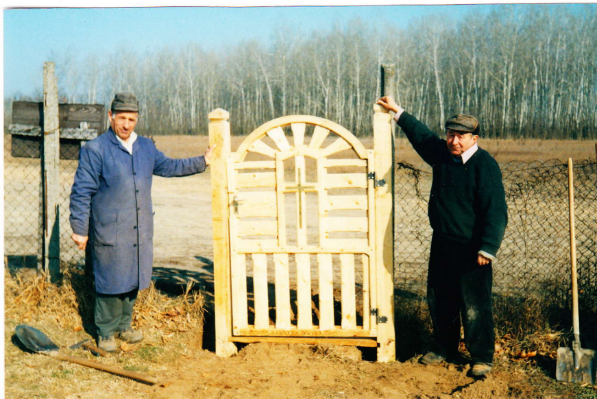
Sisák János ajándéka, a temetői kapu